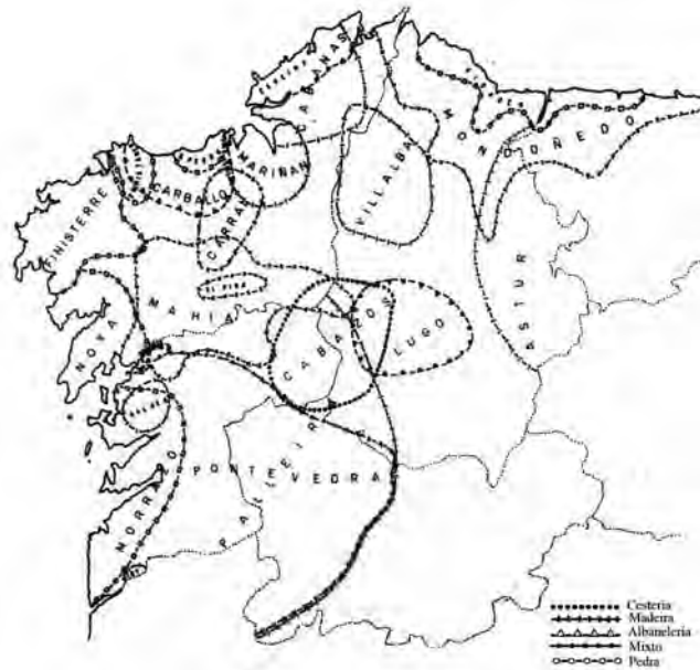
Mapa 2 (tomado de Bouhier 2001:149). Material co que están construídos os hórreos.