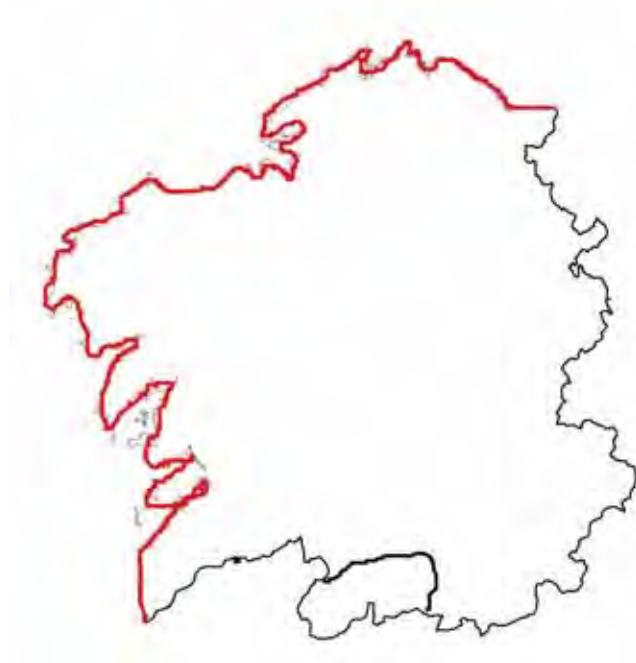
Mapa 3. Tipos de residencia matrimonial. En branco, mellora patrilínea e residencia patrilocal; en vermello, mellora matrilineal e residencia matrilocal; e, en negro, partillas igualitarias e residencia natolocal.

Ourense, de asentamentos grandes. No resto de Galicia, de asentamentos pequenos e espallados, o marido tería serias dificultades para atopar na súa aldea unha moza que non fose parente; e se casase cunha moza doutra aldea, moi probablemente se vería obrigado a longos desprazamentos diarios para durmir coa esposa.