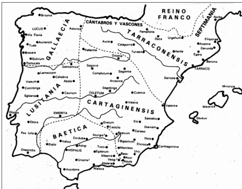
Mapa 3. As provincias do reino visigodo no século VII (Orlandis 1987: 135)

na total identificación entre espazo político e espazo eclesiástico que dotaba de cohesión interna as terras comprendidas entre o cabo Ortegal e o río Mondego, entre Fisterra e Astorga (David 1947). Porén, estas mesmas fontes informativas fálannos dunha división operativa das doce dioceses do reino svevo en dous conxuntos diferentes divididos polo río Limia: mentres os bispados meridionais estaba directamente sometidos á xurisdición do metropolitano bracarense, as sés setentrionais forman parte dunha sub-provincia eclesiástica presidida polo bispo de Lugo, o que parece apuntar ao recoñecemento dunha realidade específica e común, na que é tentador ver un precedente da futura Galicia. En resumo, a creación e consolidación do reino svevo-galaico de Braga, aínda que se realice no marco da vella provincia romana de Gallaecia , supón un claro distanciamento desta en canto ao seu marco operativo: mentres se quebra a conexión cos territorios transmontanos da Meseta e Asturias, ábrese un novo vínculo coas terras atlánticas alén do Douro. Dito doutro xeito, a formación do regno suevorum comporta unha reformulación da xeografía histórica do Noroeste peninsular que se aparta dos precedentes romanos e supón unha certa prefiguración da posterior conformación do concepto medieval de Galicia (mapa 2).