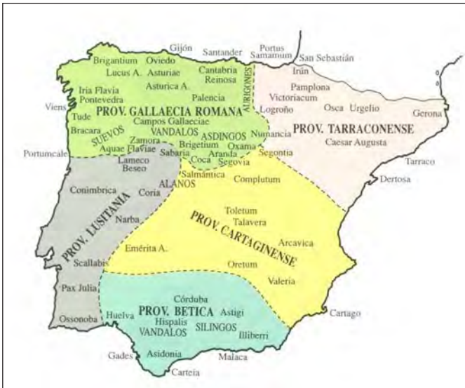
Mapa 1. Repartimento do territorio de Hispania polos pobos bárbaros a principios do século v (Baliñas Pérez 1991: 178)

O noso punto de partida nesta pescuda histórica constitúeo a provincia romana baixo-imperial de Gallaecia , tal como se foi definindo entre os séculos III e IV, que abrangúa administrativamente o territorio hispánico entre o mar Cantábrico e o río Douro, dende Fisterra no oeste ata unha fronteira oriental que oscilaba entre os ríos Cea, Pisuerga e mesmo as marxes occidentais do Sistema Ibérico (Torres Rodríguez 1949 e Rodríguez Colmenero 1996).