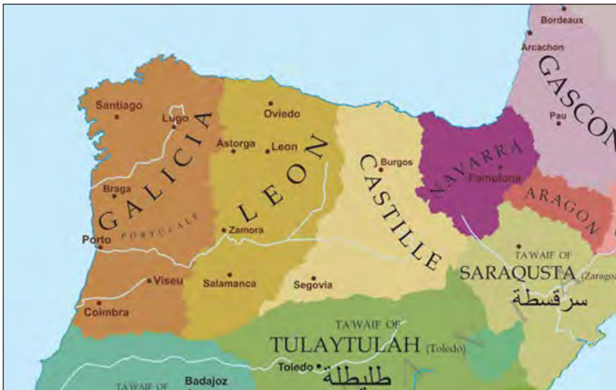
Mapa 4. Mapa político do norte da Península Ibérica cara ao ano 1065 45

En efecto, Afonso VI (1070-1109) foi rei de Galicia, asinando e sendo considerado como tal, dentro e fóra do territorio galaico 46 e gobernando o territorio galego como una parte diferenciada dos seus dominios, cunha administración propia e específica 47 .