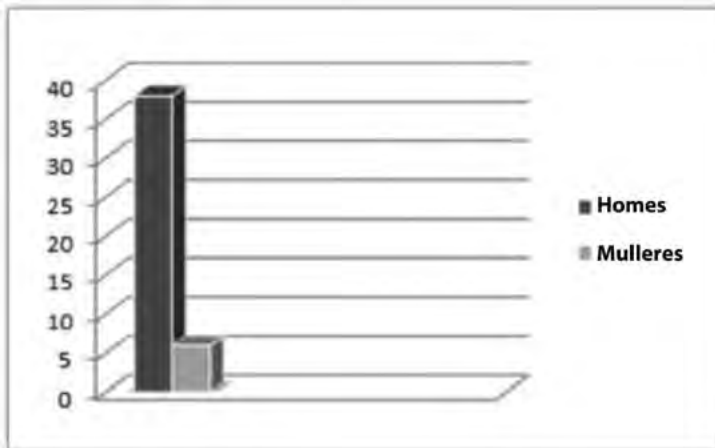
Gráfico 1: Dance East, Rural Retreats: Ballet into the 21 st Century (2005). Dirección das compañías de ballet

Nunha mesa redonda organizada por Dance Umbrella e Dance UK no ano 2009, a xornalista e crítica Judith Mackrell comentaba os seguintes datos: en 2008, das 59 compañías importantes de danza estadounidenses, 45 estaban dirixidas por homes, 10 por mulleres e as restantes catro estaban dirixidas por un equipo de home e muller. De igual xeito, ao se examinaren as subvencións outorgadas polo National Endowment for the Arts en 2008, as cifras indicaban que, dos 18 coreógrafos que recibiran subvencións, 13 eran homes, cunha media de subvención de 10 000 dólares, mentres que a subvención media recibida polas mulleres era de 5000 dólares (Dance Umbrella 2009).