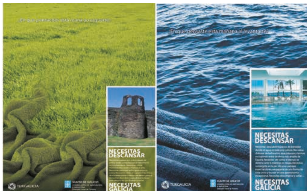
Figura 3. Imaxes turísticas promocionais de Galicia (2007)

A influencia do Camiño na imaxe de Galicia é tan forte que unha lectura dos principais atributos que o país ofrece ao visitante non fai senón reforzar aqueles elementos dos que o peregrino goza na súa camiñada a Compostela. Por unha parte, a paisaxe, dominada polos verdes e os azuis atlánticos, que se identifica coa paleta de cores máis valorada polos turistas contemporáneos influídos polos patróns románicos e dos grandes mercados emisores do nordeste europeo. Por outra, a gastronomía e un conxunto de elementos da cultura tanto material como inmaterial. Unha vez máis, a comentada asociación entre Galicia e as producións agrarias e mariñeiras refórzase como unha motivación para practicar o turismo aquí. Pero tamén a existencia dunha fala propia, unha cultura musical e etnográfica específica e unha personalidade marcada se combinan para definir unha forte posición turística baseada nas experiencias. Por último, o patrimonio cultural (igrexas románicas e barrocas, mosteiros, conxuntos históricos etc.) e natural (espazos singulares na costa, pequenas illas, áreas de montaña interior etc.) singulariza o terceiro grande atractivo dun territorio que, nestes últimos anos de xeito evidente, se beneficia moito do enorme éxito turístico do conxunto da Península Ibérica.