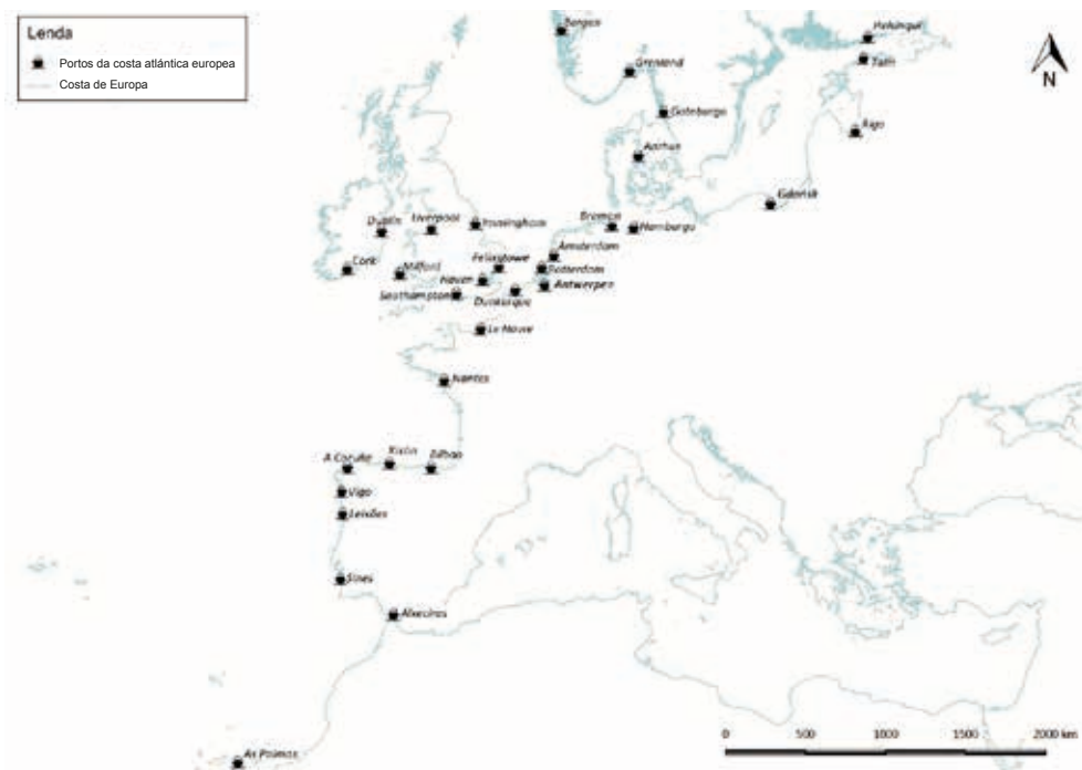
Figura 2. Principais cidades portuarias europeas da fachada occidental do continente