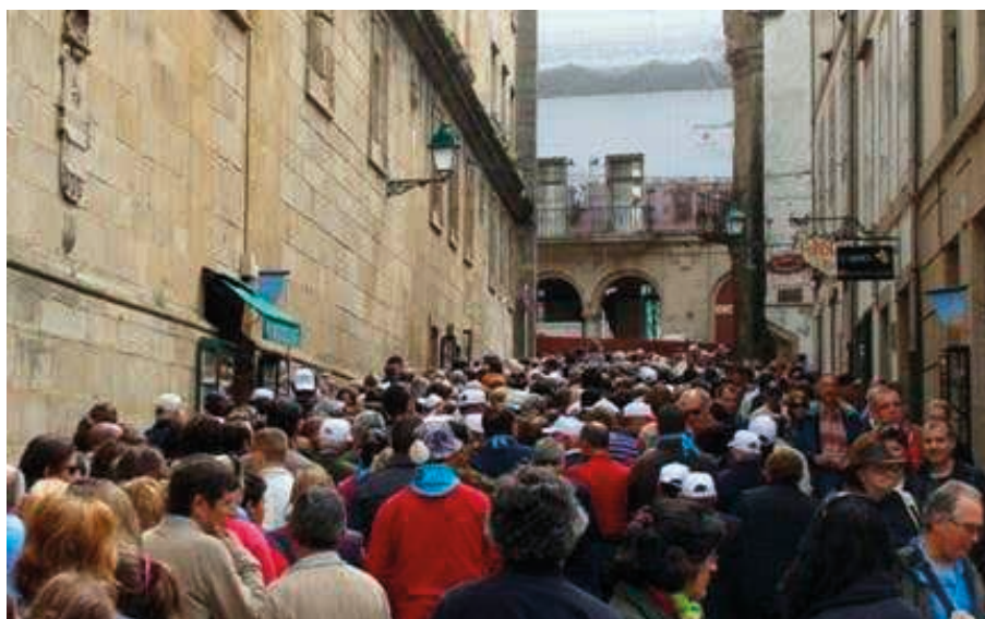
Figura 4. Imaxe da saturación turística de Santiago de Compostela

o cabo Fisterra, xa tiveron problemas recorrentes de masificación. Indubidablemente, o turismo creceu moito nos últimos tempos como expresión hedonista á saída dunha crise económica moi dura. A cuestión que se abriu é a seguinte: até onde pode continuar este crecemento? Ou, formulado doutro xeito, cumprirá introducir criterios de capacidade de acollida dos destinos e decrecemento no próximo período? O debate fica aberto.