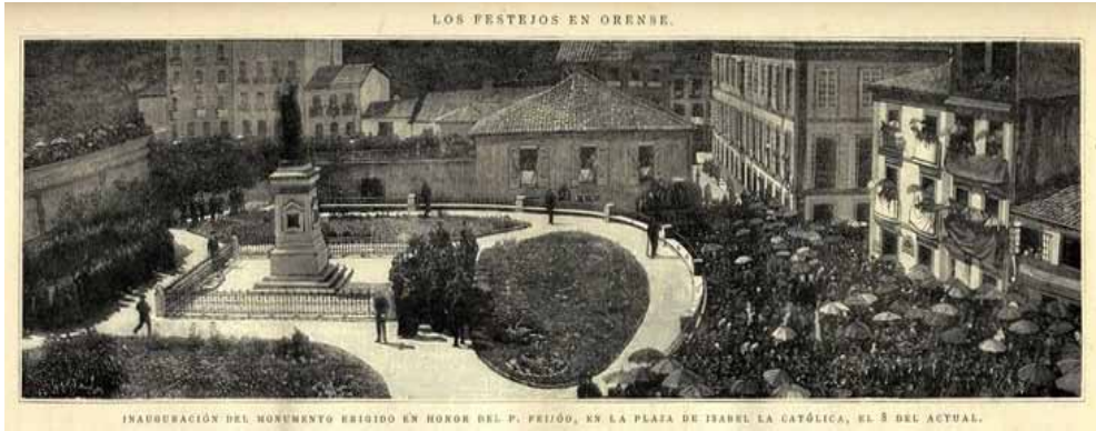
Inauguración en Ourense da estatua do Padre Feijoo (1887)