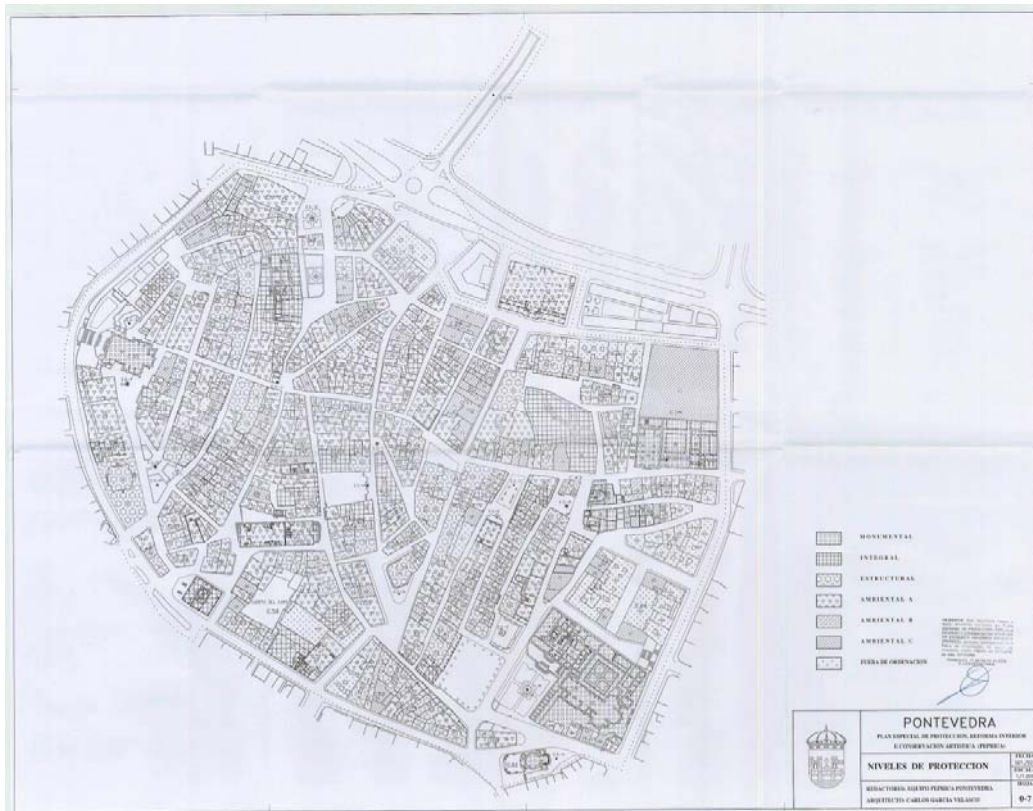
FIGURA 3. PLANO DE CATALOGACIÓN DA CIDADE DE PONTEVEDRA ONDE OS EDIFICIOS CON PROTECCIÓN INTEGRAL NON CHEGAN Á VINTENA, POLO QUE, EXCEPTO OS MONUMENTOS, O RESTO, PRACTICAMENTE A TOTALIDADE, TEÑEN PROTECCIÓN AMBIENTAL OU ESTRUTURAL.