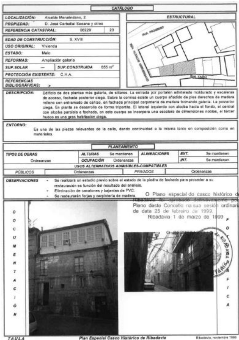
FIGURA 1. FICHA DO PLAN ESPECIAL DO CASCO HISTÓRICO DE RIBADAVIA, CORRESPONDENTE A UN EDIFICIO DO SÉCULO XVIII. A PROTECCIÓN EXISTENTE REMÍTESE AO CHA [CONXUNTO HISTÓRICO ARTÍSTICO, “DECLARADO COMO CONJUNTO MONUMENTAL POR DECRETO DE 17 DE OCTUBRE DE 1947 (B.O. DEL 30 DE OCTUBRE DE 1947) A TRAVÉS DE UN INFORME REALIZADO POR D. MANUEL CHAMOSO LAMAS EN EL QUE SE PROPONE UNA DELIMITACIÓN” ( HTTP://WWW.PLANEAMENTOURBANISTICO.XUNTA.ES/SIOTUGA/DOCUMENTOS/URBANISMO/RIBADAVIA/DOCUMENTS/2409NO001.PDF )]. NA FICHA NON SE RECOLLEN PORMENORIZADAMENTE OS ELEMENTOS SINGULARES QUE HAI QUE PROTEXER DO INMOBLE.

Nas Normas de aplicación directa, a lei substitúe o réxime mínimo de protección da LPC/16 por un réxime de protección máxima aplicable a dous niveis de protección: ambiental e estrutural e aos niveis “asimilables” a estes.