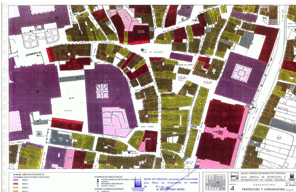
FIGURA 2. PLANO DE CATALOGACIÓN DA CIDADE DE SANTIAGO DE COMPOSTELA ONDE SE APRECIA QUE A INMENZA MAIORÍA DOS EDIFICIOS ESTÁN CATALOGADOS EN NIVEIS 3 (EN AMARELO) E 4 (OCRE), “ASIMILABLES” AOS AMBIENTAL E ESTRUTURAL DA LPC/16.

Nos seguintes exemplos (Figuras 2 a 5) apréciase claramente como as Normas de aplicación directa da Lei sobre os edificios con protección ambiental e estrutural son de aplicación á maior parte do tecido urbano dos conxuntos históricos declarados bens de interese cultural, o que permite apreciar a gravidade das cuestións sinaladas nos parágrafos anteriores.