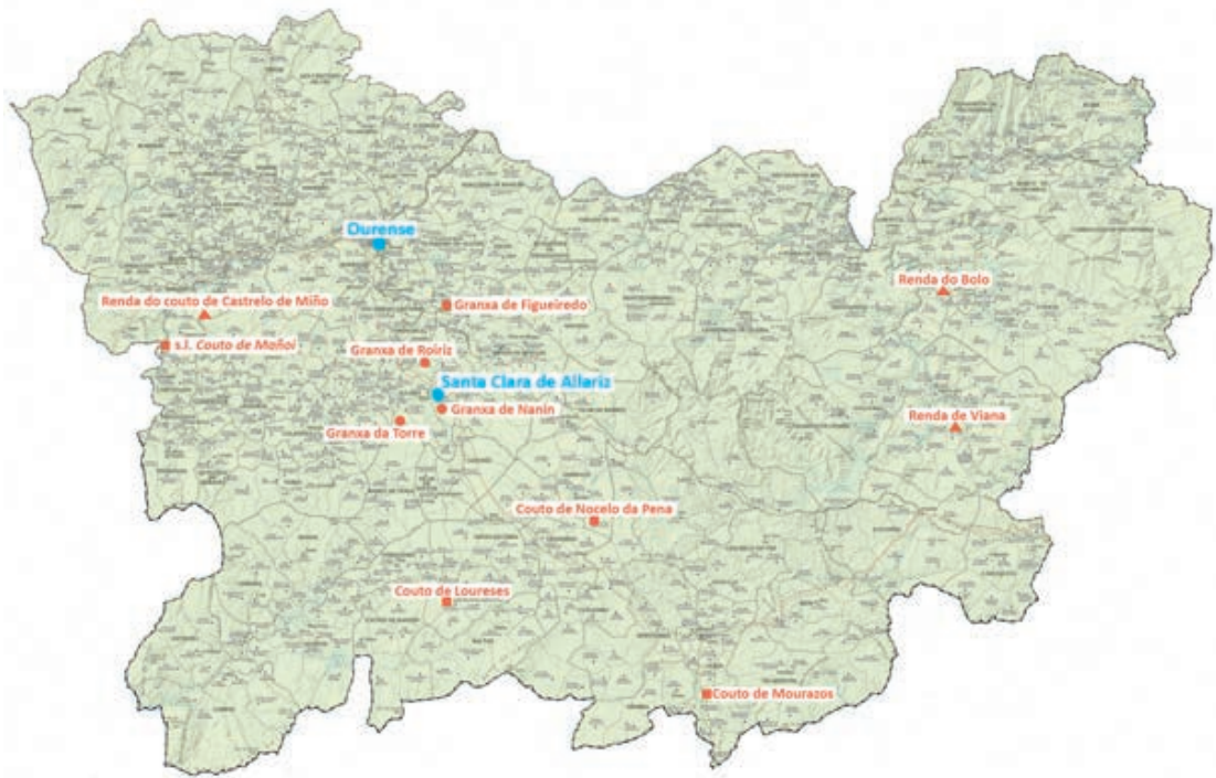
Mapa de coutos, granxas e rendas de Santa Clara de Allariz [Elaboración propia sobre o Mapa de parroquias de Galicia 1:200.000 (2009)].