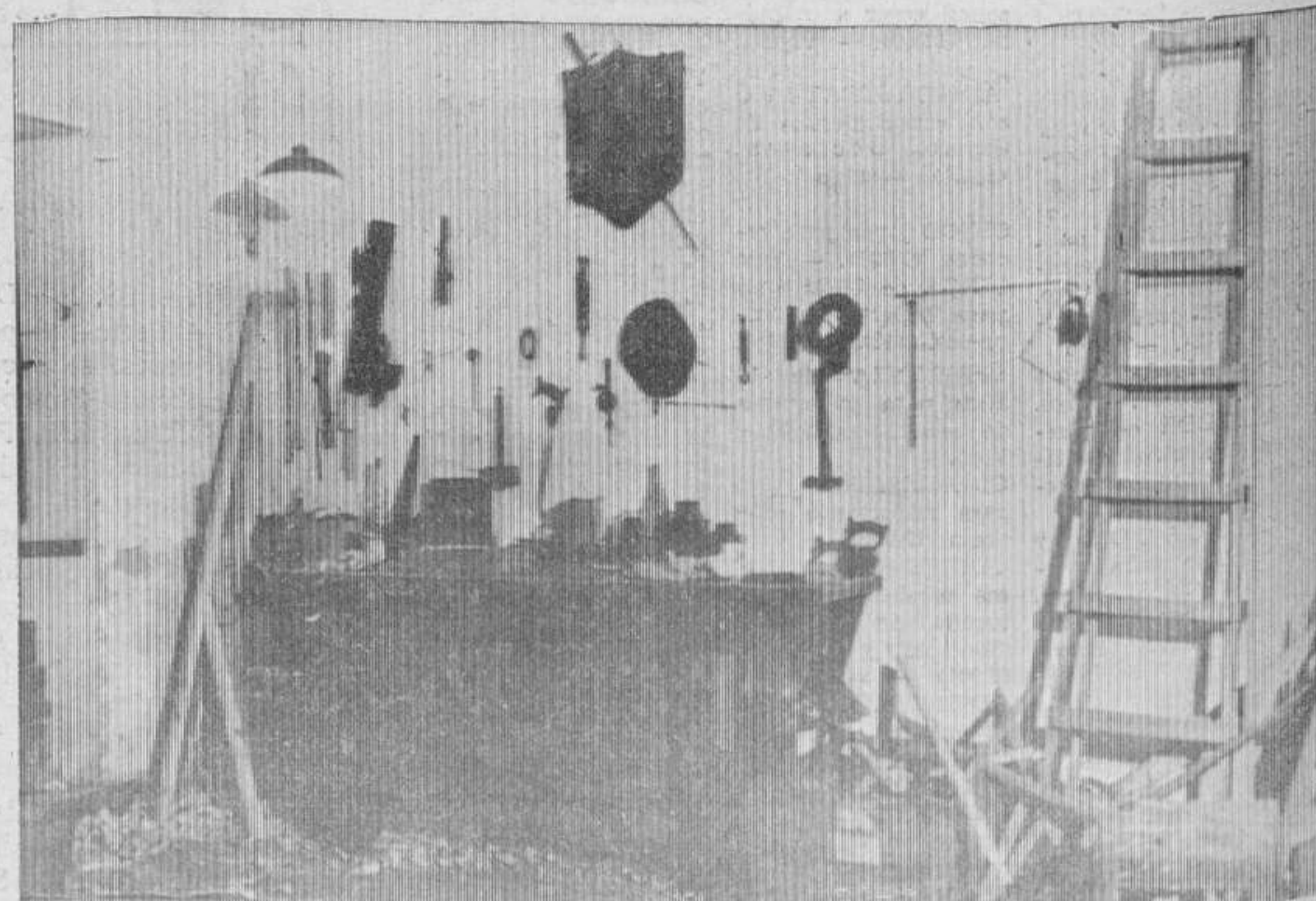
El banco de carpintero donde se realizan los trabajos para escenificar la labor de "Ditea".