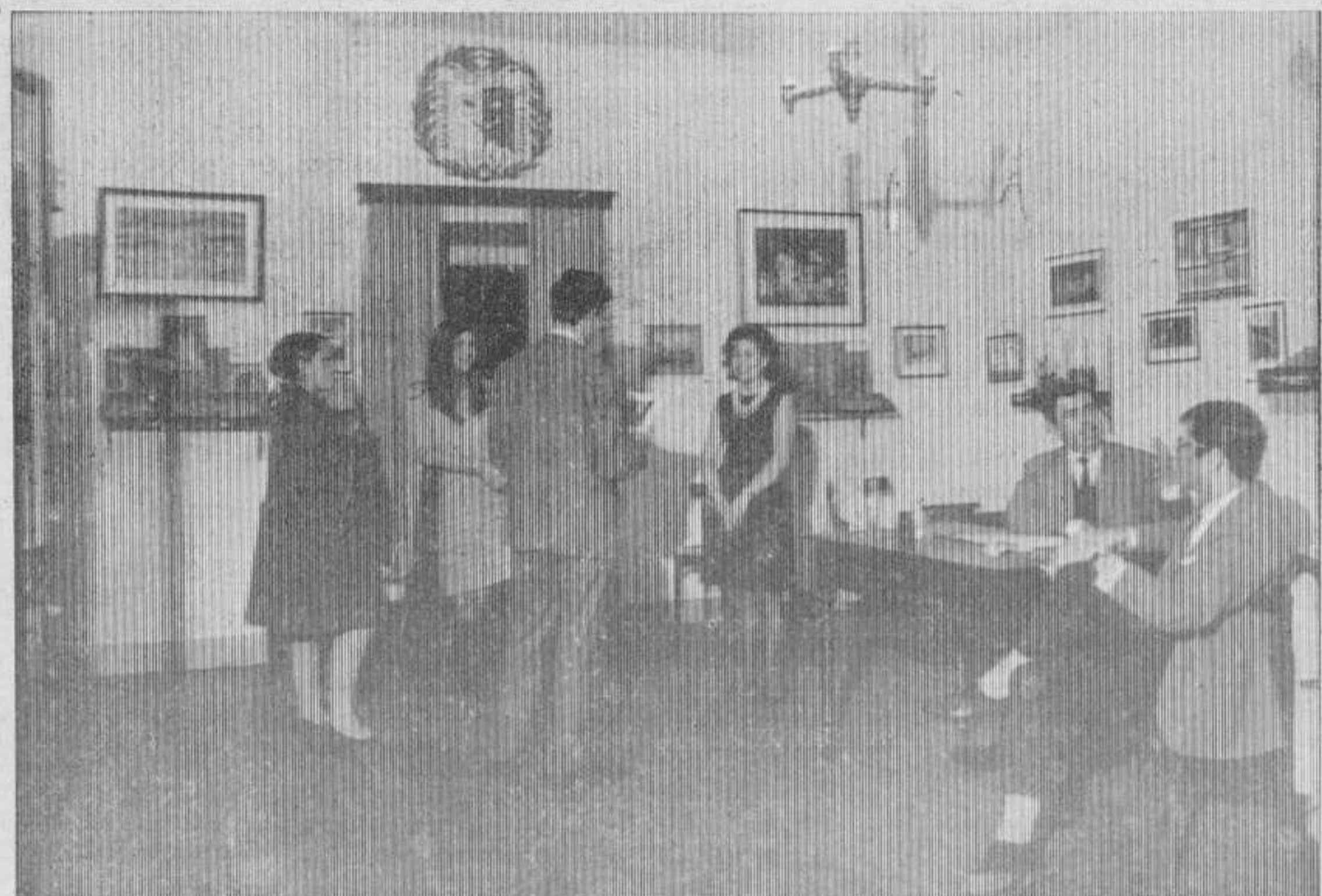
Un grupo de actores ensaya.