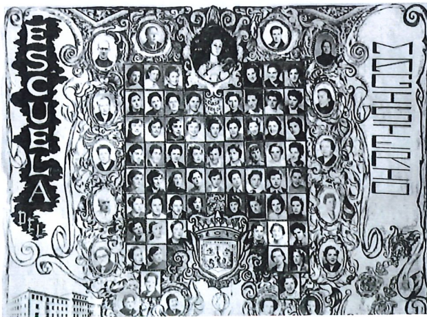
Orla da promoción 1955-56, no novo edificio da Escola de Maxisterio.

Polos seus coñecementos de alemán colaborou na tradución da "Historia del Arte en todos los tiempos y pueblos" de Karl Woenmann (WOERMANN, Karl, 6 tomos. Editorial Saturnino Calleja, Madrid, 1930).