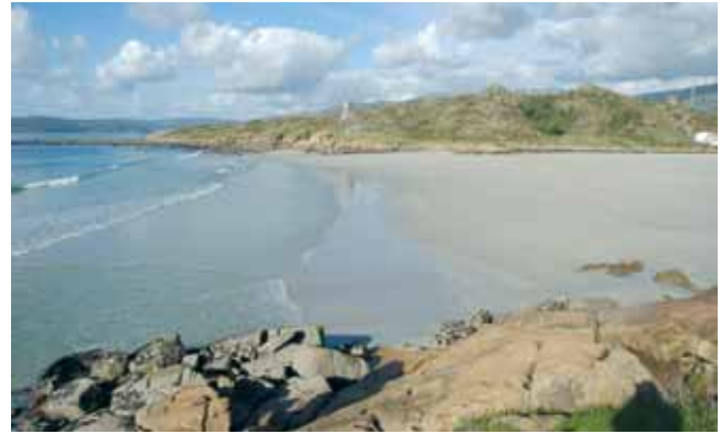
Porto do Pindo

O sarxento de oficinas chamou á parte o seu superior xerárquico e díxolle unhas palabras en voz baixa.