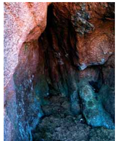
Unha das covas que no Pindo serviron de agocho aos "fuxidos" do 36