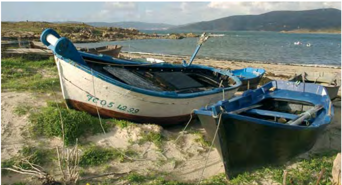
Porto de Quilmas

E a mariñeira de Quilmas seguiu indo ó mar con bastante fortuna. A filla máis vella empezou a encargarse de levar o peixe a vender, e o traballo, sendo aínda moito, facíase máis levadeiro. As viaxadas ó monte, os oportunos avultamentos de