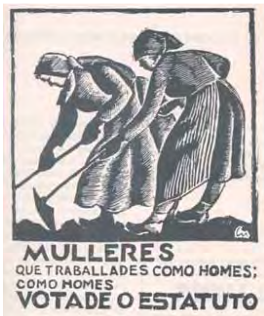
Cartaz de propaganda para o plebiscito estatutario de Xuño de 1936.

coellos polos penedos do Pindo, e gastaba aló moitas horas, quizabes non tan proveitosas, pero si máis gustosas cás da pesca, oficio que practicaba máis por necesidade ca por vocación.