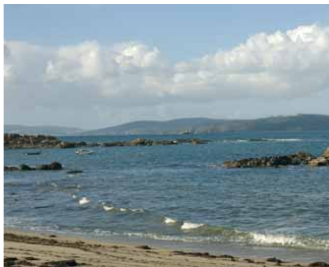
Porto de Quilmas