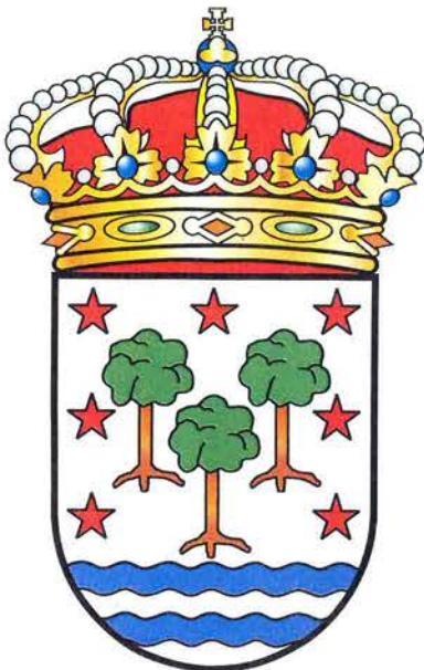
Escudo do concello de Cabanas.