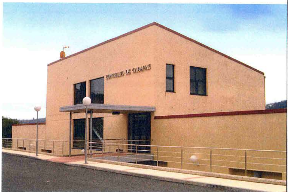
A nova casa do concello de Cabanas.