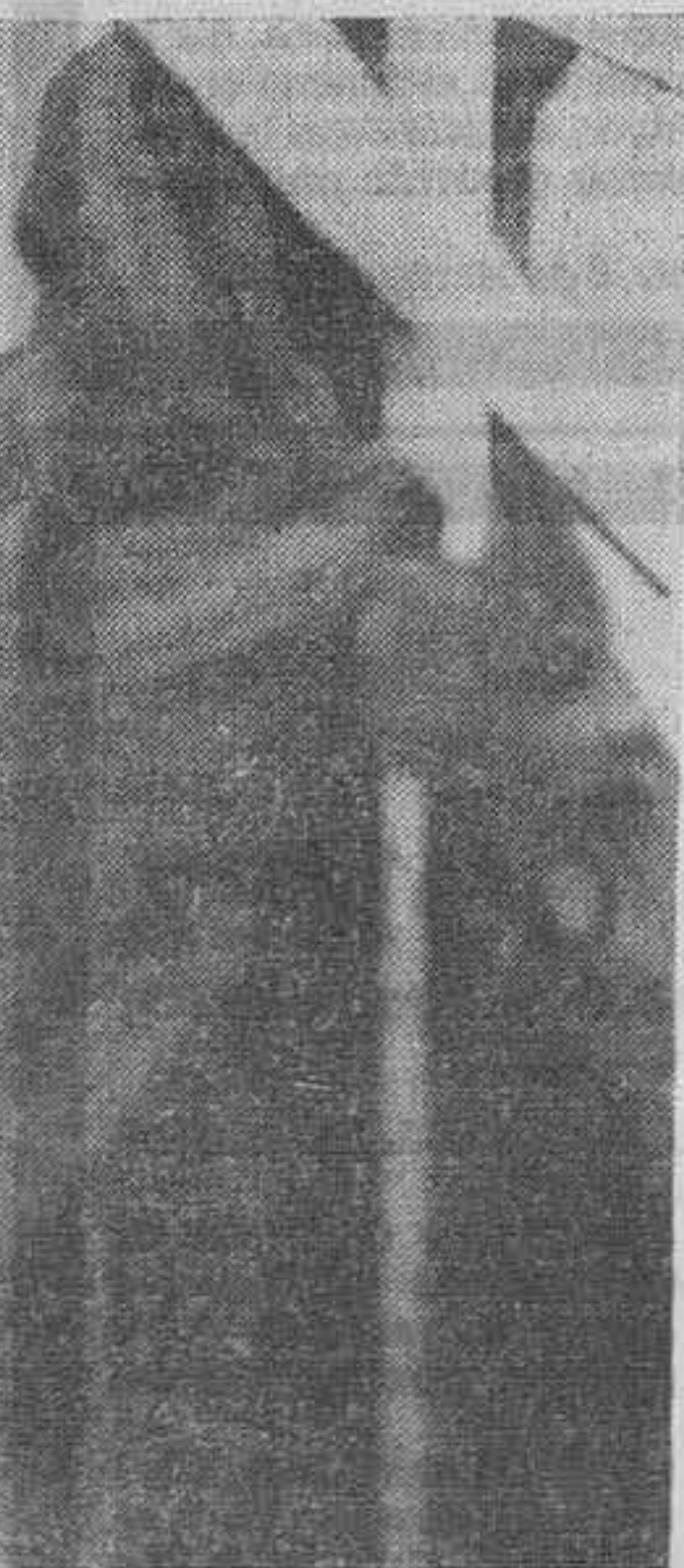
Esta fotografía está colgada en uno de los salones del Museo de Arte Moderno de Nueva York. (F. Terré)

—Un disconformismo ante la fotografía española. Coincidimos en una exposición que se celebraba en Barcelona y tuvimos ocasión de manifestar nuestro descontento ante lo expuesto y de cirnos. Como nuestros criterios eran idénticos, conversamos y al fin llegamos a la conclusión de que