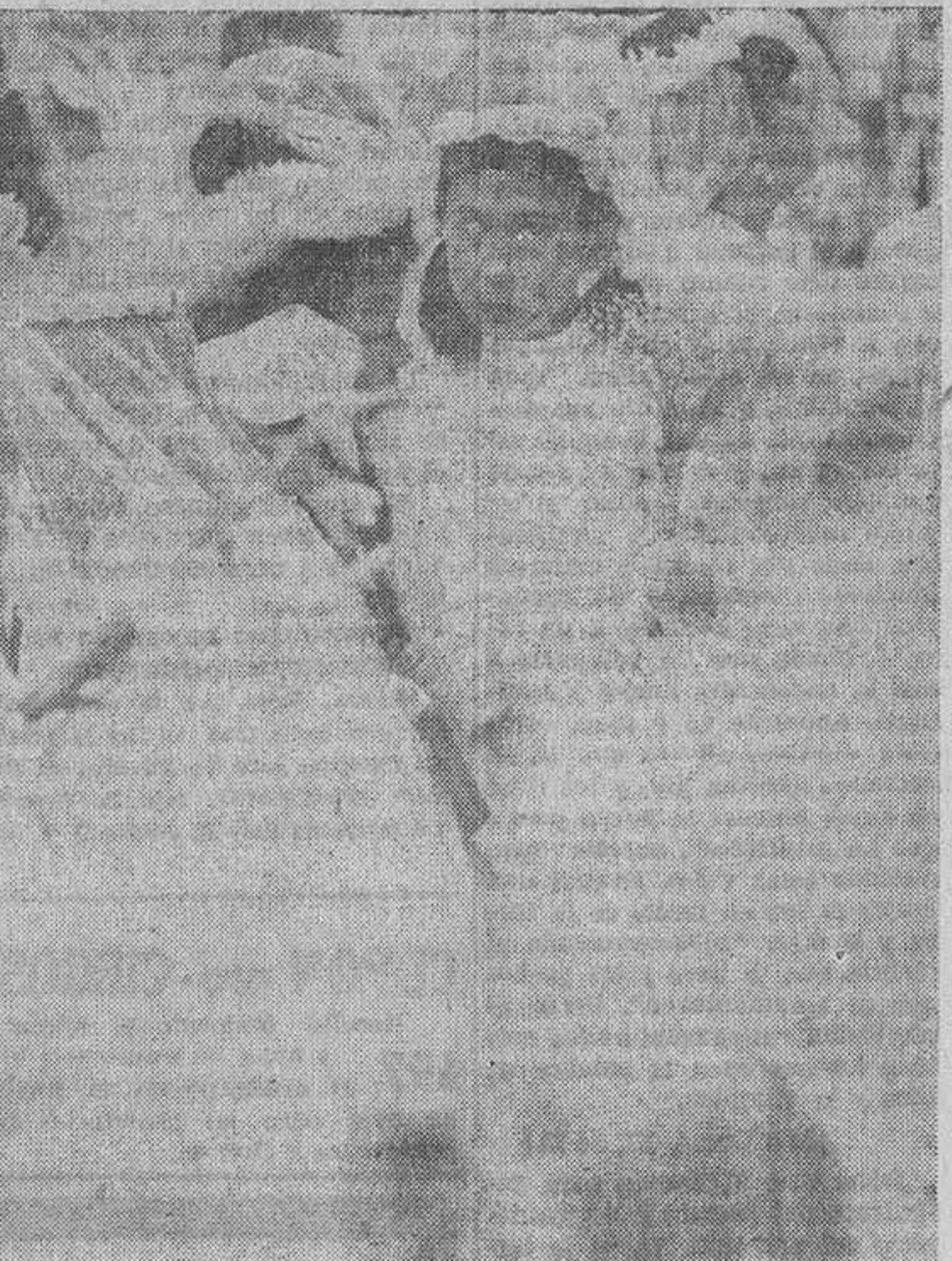
Gracias a esta fotografía, que dice muchas cosas al corazón, la niña fue conocida por un especialista y pudo ser operada con éxito de su defecto visual.

la única forma de reformar era dar ejemplo. Montamos una exposición los tres. Aquello fue un cañonazo. Tuvimos mucho éxito ante el público pero nos boicotearon cuanto les fué posible algunos profesionales y aficionados que empezaban a caer del pedestal. Al mismo tiempo que ocurría aquello, en Almería se iniciaba un grupo más amplio, llamado APAL al que pertenecemos. Sus componentes nos pidieron obras, las expusieron y estamos desde entonces en constante relación.