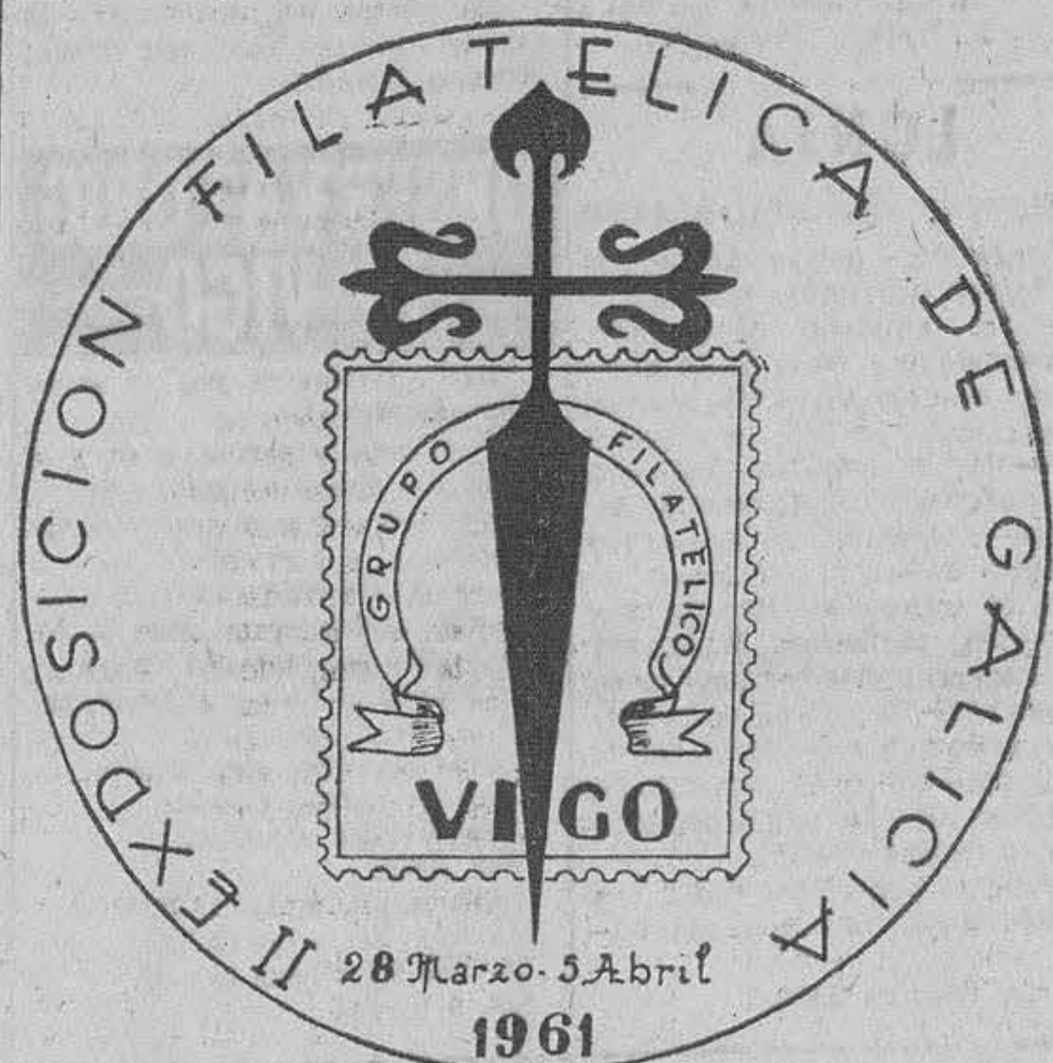
Este es, notablemente ampliado, el dibujo del matasellos especial que se utilizará en Vigo con motivo de la II Exposición Filatélica de Galicia.

Con tal motivo será utilizado un matasellos especial