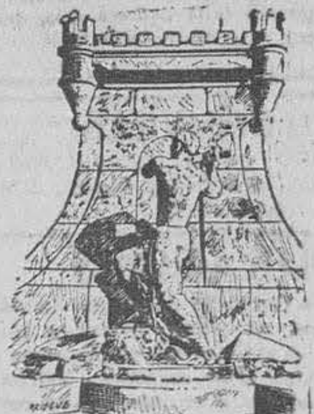
Puerta de la Gamboa