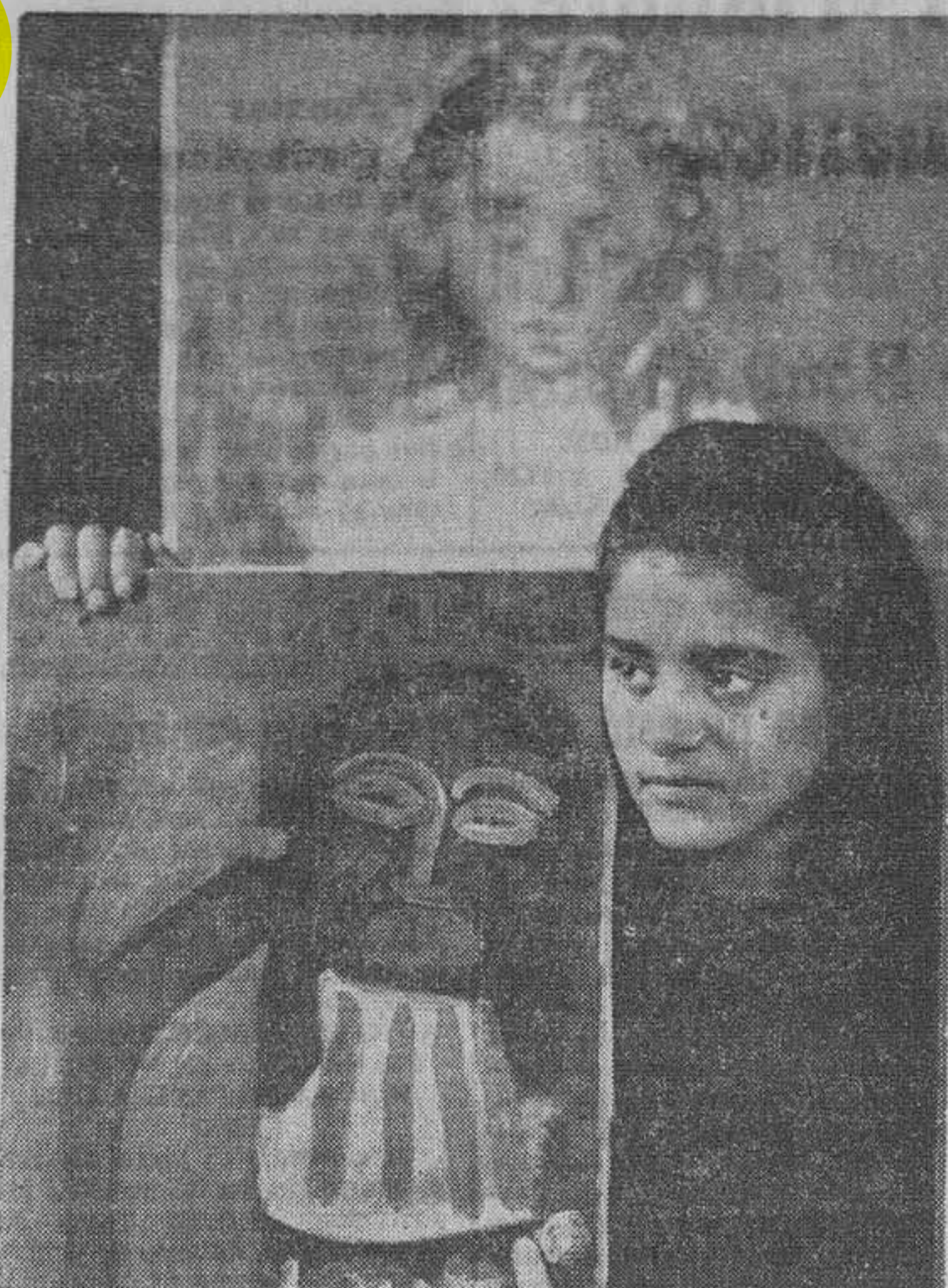
Original y expresivo, el retrato exhibe una faceta poco conocida de "La Chunga", que además de bailarina es una excelente pintora. (F. Terré)