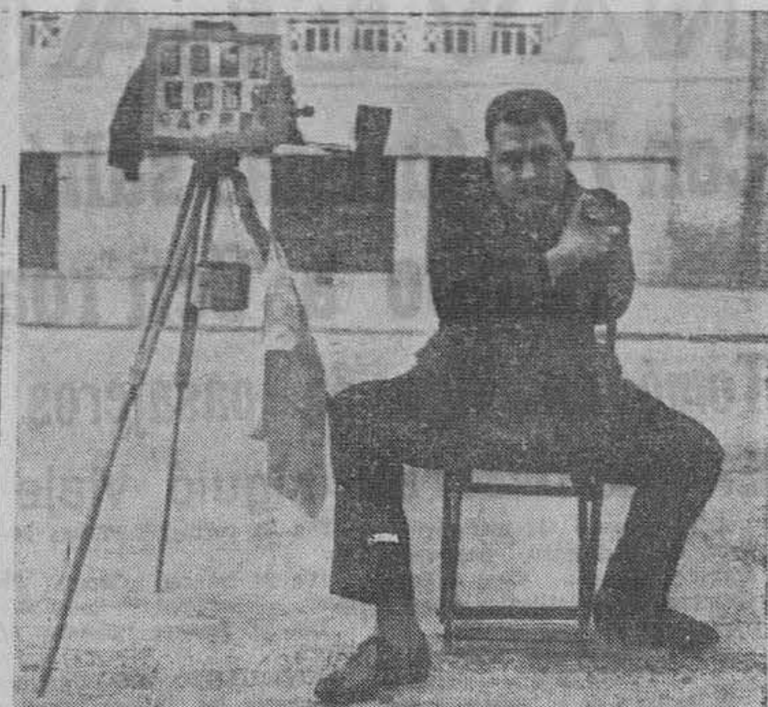
El autorretrato, con su fina pinelada de humorismo, ha sido el único que, firmado por un español, aparece en la primera antología de fotógrafos universales, que acaba de publicarse en Alemania. (F. Terré)