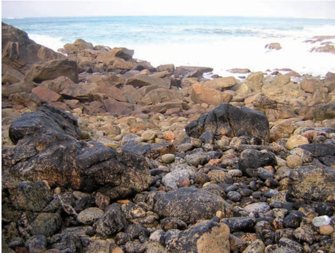
Figura 6. Aínda chapapote nas rochas da beiramar, preto do Cabo Vilán (Camarifiñas, Terra de Soneira).