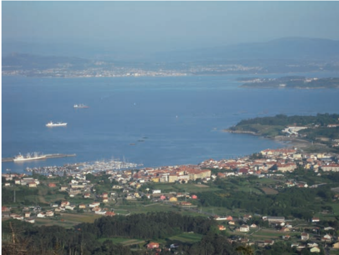
Figura 5. Vista da ría de Arousa desde A Curotiña, coa Pobra do Caramiñal (O Barbanza) nun primeiro plano e Vilanova de Arousa (O Salnés) na ribeira oposta. (2.5.2009).

urbanísticas, territoriais, etc. Mesmo existe unha derivada paisaxística importante na medida en que progresivamente a Galiza será asociada ao mar e ás Rías Baixas en concreto, o que comporta unha sinécdoque.