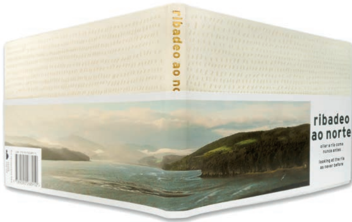
Figura 9. Portada do libro de Mariola López Mariño (2012).

presenza cotiá da mesma na súa infancia, con motivo do nacemento da súa filla. O resultado é unha colección de imaxes que revela unha dimensión profunda da ría que se distancia das visións rápidas do día a día, o que resulta nunha produción sedimentada da paisaxe onde as coordenadas íntimas teñen un papel de primeira orde. O subtítulo significa por si mesmo: «ollar a ría coma nunca antes». A ría sempre estivo aí, pero non se mirara dese xeito até daquela. Ademais, as fotografías teñen unha evidente inspiración e vontade zen . Deste xeito, a tradición oriental da reflexión calma e da sapiencia baseada na experiencia, alén do discurso racional, 12 penetran con forza na creación paisaxística galega. A lámina mariña da ría de Ribadeo é o centro destes retratos fotográficos, que revelan unha impresionante capacidade de fixar o cambio da paisaxe mariña ao longo do tempo, en contra da tese coa que iniciamos este traballo de que o mar «borra decontado do rexistro perceptivo na súa delicuescente inconsistencia paisaxística» (Folch e París, 1999: 18).