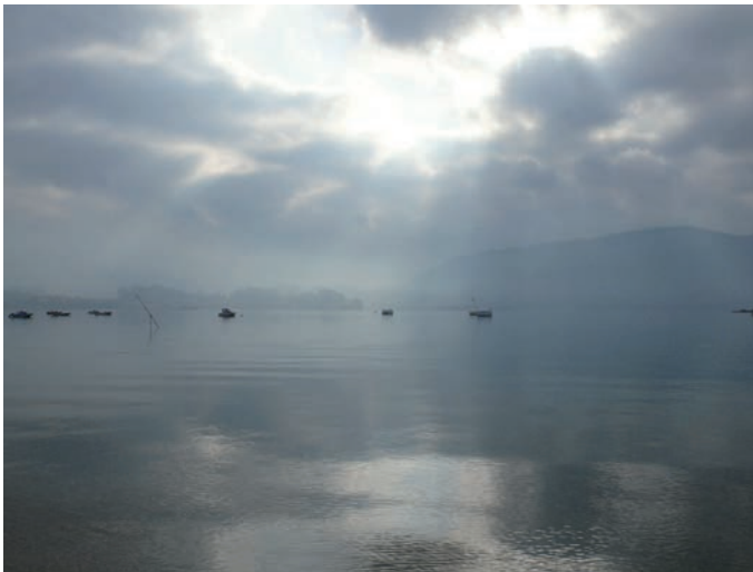
Figura 2. A lámina mariña da enseada de San Simón desde a praia de Cesantes (concello de Redondela), na súa habitual configuración calma.