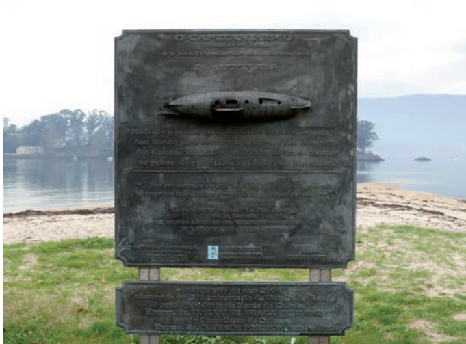
Figura 3. Monumento ao capitán Nemo e o submarino Nautilus na praia de Cesantes (concello de Redondela), coa illa de San Simón detrás.