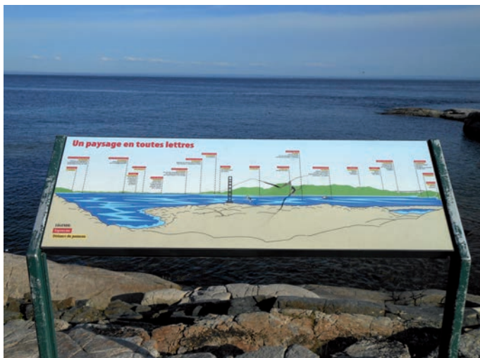
Figura 1. Uso da palabra «paisaxe» nun leteiro turístico para referirse á superficie mariña do esteiro do San Lourenzo e a un horizonte terrestre afastado. Tadoussac, Côte-Nord, Québec.