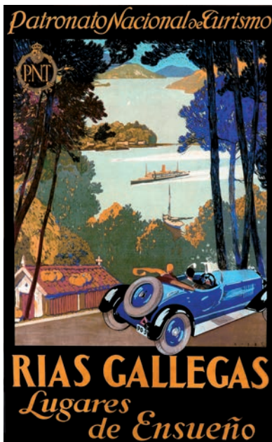
Figura 4. Cartel turístico de Federico Ribas (1930).

En realidade, o cartel non é unha manifestación paisaxística illada, senón que se insire nun discurso que, fundamentalmente irradiado desde as elites españolas instaladas en Madrid, reservaba para a Galiza unha imaxe de «rexión» (as comiñas son intencionadas) marítima, costeira e litoral que pagaba a pena coñecer turisticamente (Paül et al. , 2011b: 27-28; Paül e Pazos Otón, 2010: 219). Esta lectura é paisaxística de cheo e non conecta coas narrativas paisaxísticas