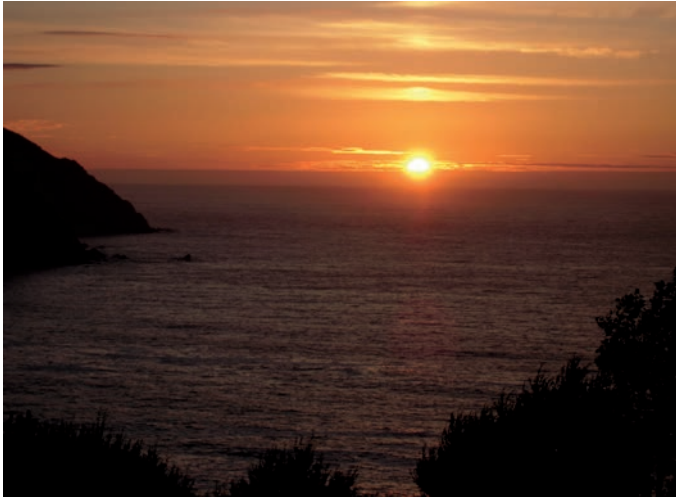
Figura 8. Solpor desde Santo André de Teixido (Cedeira, Ferrolterra).

«Toda a montana obedesce o ritmo mariño. Refunfuxando os feixes disformes de esquistos dóbranse e cain na mar. N'hai orela. A montana asulágase n'un pulo unánime na mar. É pouco doado ô principio darse conta da medida, atopar un canon pra istas enormes sinxelezas. [...] Unha chea de mar rube pol-o ceo coma pr'asulagar toda a paisaxe. A montana crébase en cañadas súpetas abertas por torrentes agora enxoiros. Aduvíñanse baixo as pizarras calcadas, sobrepostas, casadas ô lonxe de largos estrados deitados ou rompídos, unha auga doce, de entrana de pedra, qu'as veces alumbrava en fontes deseguida fuxitivas desexosas do labio salgado do océano. N'unha das quebradas[,] na máis artellada, na que cría un oco garimoso[,] o vivir humán predeu semellante a unha pranta enraizada na fenda d'unha roca: San Andrés. Sinxelamente o santuario. Pois somentes un místico anxeio podía latexar eternamente, indifrente ôs cambeos dos tempos na primaria sinxeleza cósmica da costa terminal. [...]