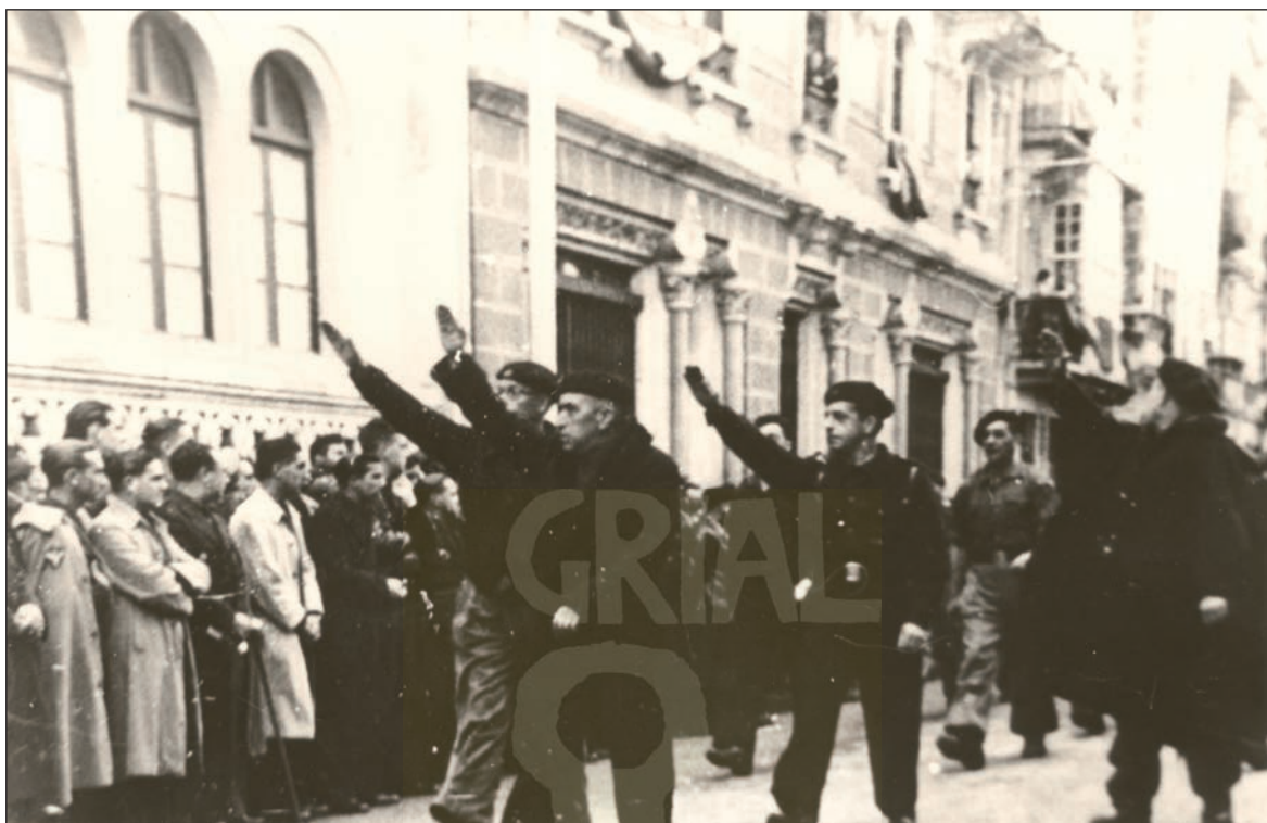
A Coruña, 1940, desfile falanxista no cabodano da morte de José Antonio Primo de Rivera.

tión do dominio dunha burguesía condenada á súa desaparición histórica nun futuro próximo. E malia a “sagacidad organizativa” do partido fascista e o “agudas” que foran as “enseñanzas extraídas de los hechos revolucionarios”, a Italia de Mussolini non lograra sobardar “las contradicciones internas del Estado”. Aquela non encarnaba unha auténtica revolución na medida en que defendía os intereses, en última instancia, dunha burguesía agónica 20 .