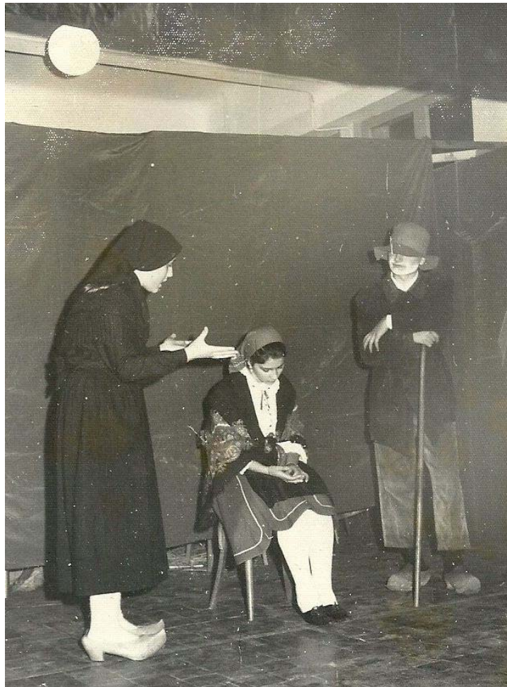
“Pimpinela”, polo Grupo de Teatro de Fingoi.

Vexamos, como exemplo, esa correspondencia de Carballo e Piñeiro do Epistolario publicado nos Cadernos Ramón Piñeiro (XXXIII) pola Xunta de Galicia. Carballo escribe (2 de maio de 1965): “Din unha lección no Curso de Galego que illustrei con recitados dos meus alumnos. Agora queren que na clausura represente toda “Pimpinela”. E aquí me tes loitando cos rapaces [...] Todo isto me rouba tempo, pero agora a xente fala do Grupo de Teatro de Fingoi, e como tal cousa non é senón catro rapaces aos que teño que hipnotizar para que non fiquen demasiado mal, véxome nun compromiso do que intento saír sen que todos fagamos o ridículo. Vou sacándome da manga, como un ilusionista, poetas e actores criados en Fingoi; e a xente os aplaude. E parece que o merecen [...] Algo supón isto para o galeguismo, e aínda que a miúdo me arrepiño de me meter en tanto labirinto, e quizás valoro excesivamente a eficacia do que pode ser ilusorio ou efémero, non sei resistir a tentación dun traballo tan ousado, que me dá unha ledicia que non acho no meu traballo persoal”. E Ramón Piñeiro contéstalle (4 de maio de 1965): “[...] son cousas que merecen todo o tempo que se lles consagre. Entre a posta de “Pimpinela” e un retraso de un mes na aparición da Gramática, coido preferible o retraso da Gramática”.