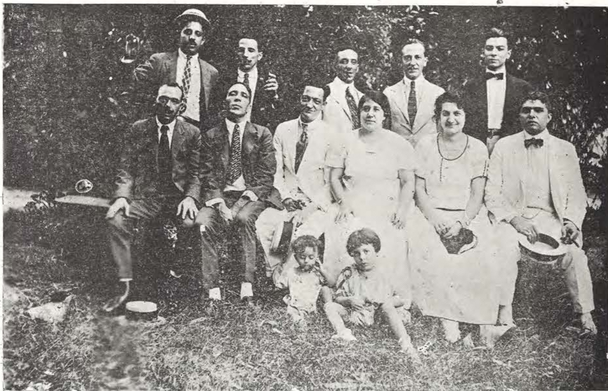
Interesante grupo de entusiastas betanceros que rememoran las alegres "ruadas" gallegas.