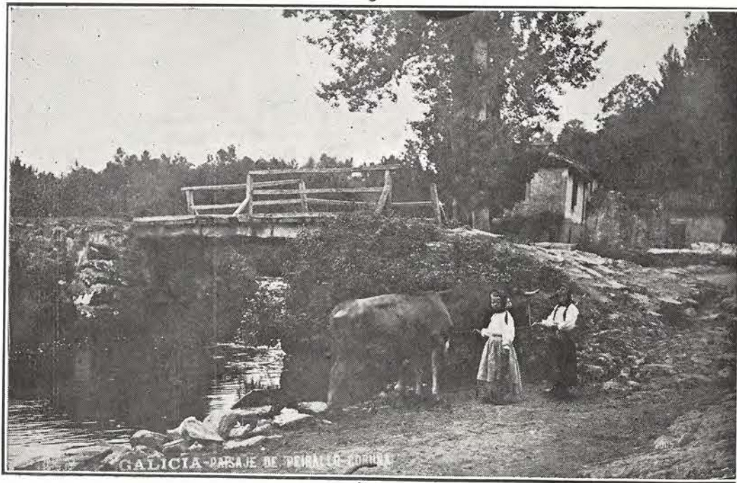
No lugare de Peirallo—as cativas tanguen gando.