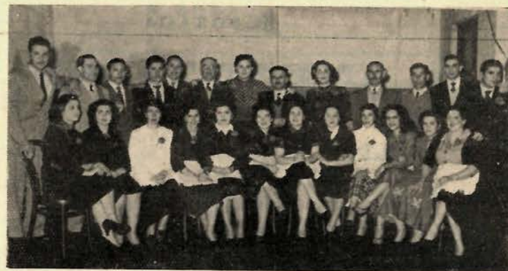
Nota gráfica en que aparecen las simpáticas chicas de la Comisión de damas que organizaron el chocolate danzante a beneficio del Hogar Gallego para Ancianos, secundadas por los miembros de la Comisión de Fiestas que las acompañan