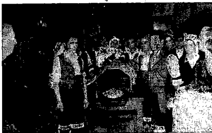
El Coro Rosalía de Castro hace guardia al ataud de su querido maestro.

Ha muerto el maestro Maceira, pero su obra, toda ella gallega, permanecerá eternamente, porque fue la obra de la difusión, conservación y conocimiento de los valores, ancestrales, atávicos y telé-