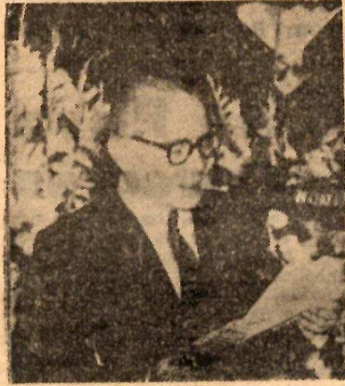
O ilustre escritor S. Xavier Bóveda, lee o seu fermoso discurso en col da obra de Castelao.

O mensaxe de Castelao está concebido no máis íntimo e enxebre da