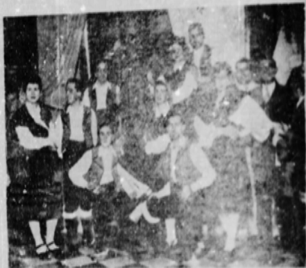
Grupo de coristas de la Coral Polifónica Casa de Galicia al pie del Apóstol Santiago que figura en nuestra sede social.