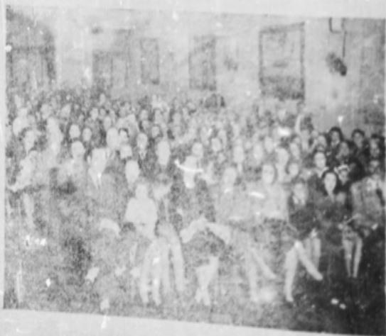
Concurrencia de familias en la fiesta infantil.