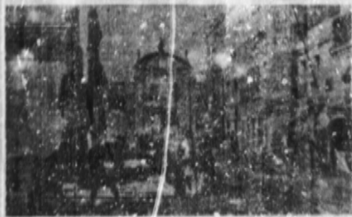
Una calle de Montevideo en la época de este relato.