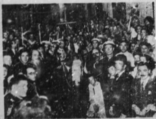
El entierro del Carnaval, tradicional pantomima gallega que, se realizó con grande coqueijos, con alcaldes, guardas, floristas, etc.