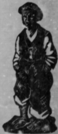
(De la Revista "Sonata Gallega de Pontevedra").

Así arremataba a dura carreira y-a escravitud do tillero.