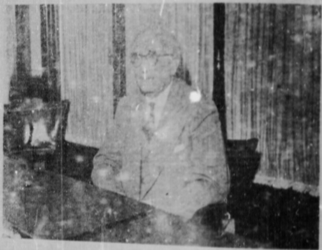
Don Salvador de Madariaga