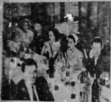
Cabeceira da mesa

Nosotros hoy también a una muchacha argentina, a una altísima artista americana que ha quedado acercarse a nosotros, a nuestra Galicia, a el personaje de esa inolvidable Chiruca, a la indécita de "Tres Hombres de Río" y de "El Camino de las Llamas", la erigimos en nuestro corazón y en nuestro sentimiento, ciudadana honoraria de Galicia para todos los gallegos que rodamos por América.