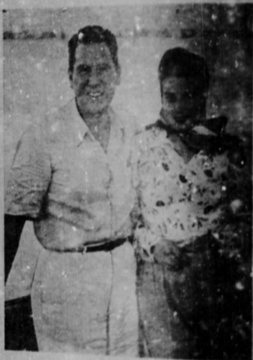
El General Perón y su esposa esposa María Eva Duarte de Perón

He aquí, unidos en tierna amistad eterna, los dos ejemplares de más apasionante relación de la América actual.