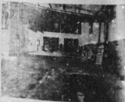
Visita nocturna de la playa