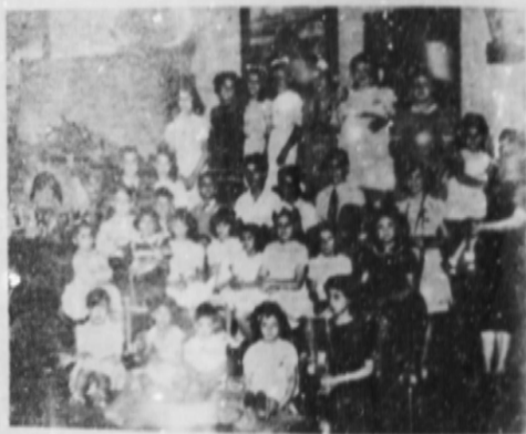
Una parte de los peque- ños concurrentes.