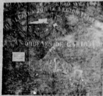
Bandera de la Legión Italiana de Montevideo