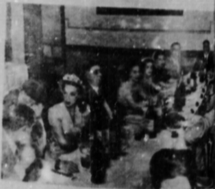
Outra vista de la cabeceira da mesa

Con esta risueña evocación del futuro he querido disimular un poco la emoción que me embarga al terminar este ofrecimiento con un "carifolho" no encontrando para finalizar palabras más adecuadas que las escritas en el cartel que está sobre nuestras cabezas: "Oulice Chiruca, benvida sempre a esta casa gallega".