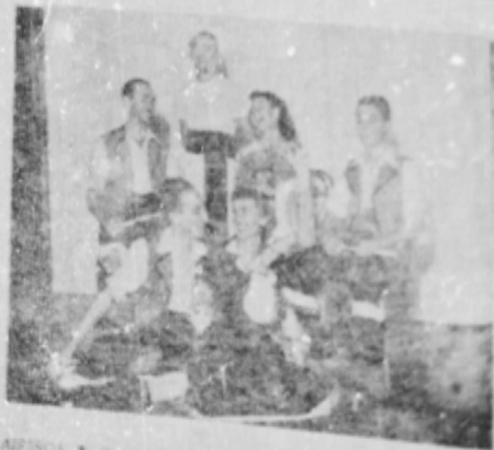
Conjunto gallego que fue muy admirado.