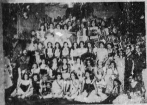
Magnífico conjunto de concorrentes a nóstros bailes de Carnaval