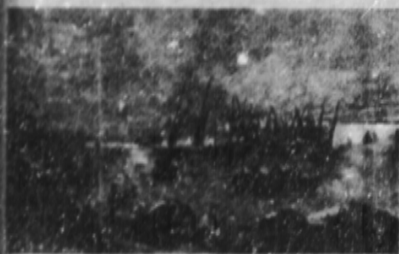
Un desembarco en Montevideo en la época de este relato.