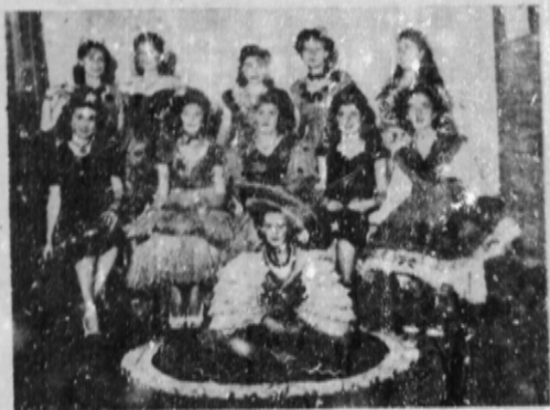
Otro bellissimo conjunto de niñas concorrentes.