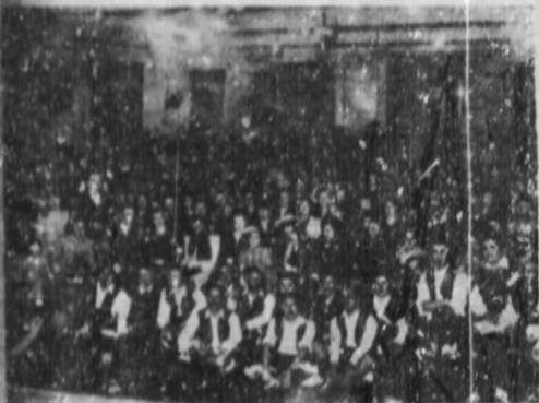
Vista de la enorme concurren- cia en nuestro festival de Ga- lcia.