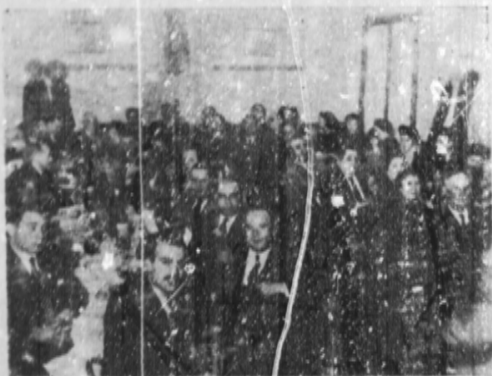
La cena de camaradería y evo- cación celebrada el día 25 de julio.