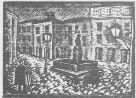
Plaza del Toral, en Compostela

Este acto se realizará en el Gran Teatro "Opera" el día 23 del actual, a las 10.30 horas en punto y será irradiado a todos los países de América y a España por Radio "El Mundo" en sus dos ondas, en colaboración con Transradio Internacional con ondas dirigidas a América y Europa.