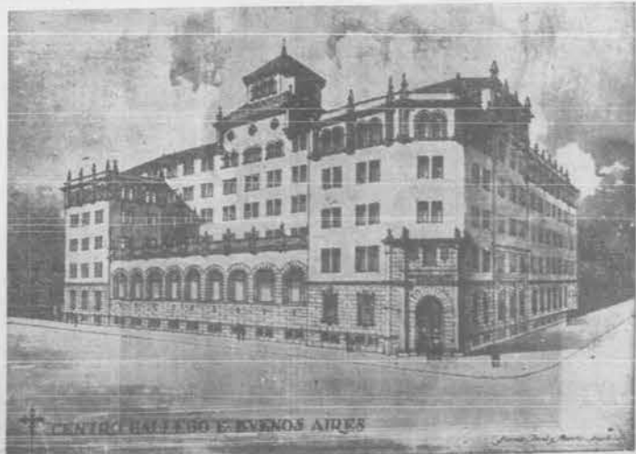
CENTRO GALLEGO EN BUENOS AIRES

La gran festividad de Galicia, alcanza día a día, mayor importancia y es de desear que el año próximo haya una mayor coordinación en los actos a realizarse.