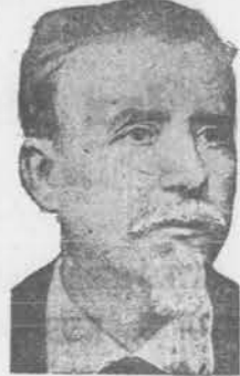
CON MANUEL MURGUIA

ron investidas. Para eso deben unirse. La solidaridad es una fuerza in vencible, a ella debemos el triunfo. Catalanes, vascos, gallegos, que tanto hemos combatido en honor de nuestras regiones, nos presentamos aquí unidos y nos tendemos la mano. Los cielos que nos cubren sean testigos de la alianza que en estos momentos contraemos; el rumor de las alas que se elevan en las playas que nos rodean. Haced a los vascos hermanos la seguridad de las prohemias que esta alianza entraña. Para mí son sagradas. Hijo de una gal que amo al país de mi madre como al mía. A Cataluña ya le dije