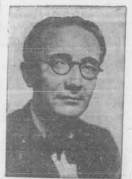
ALFONSO R. CASTELAO

no se debe la publicación de mi libro (aplausos). Y con esta parquedad de expresiones pongo punto al prólogo de mi discurso, que no ha de ser largo. Muchas gracias a todos. Muchas gracias. (Aplausos).