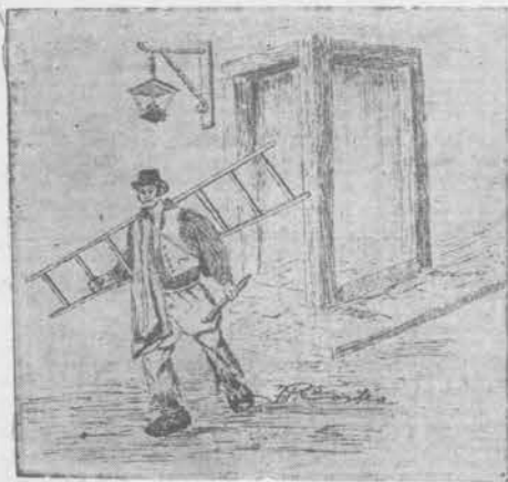
DIBUJO DE CORTES

las oscuras aceras coloniales, lo cual trajo aparejado la creación de un personaje que con el transcurso del tiempo adquirió popularidad: el farolero. En estos días, a 156 años de ver caer el primer farol, cuando contemplamos la brillante iluminación de