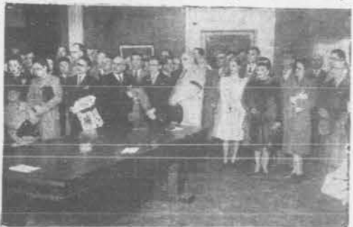
Una parte del público asistente al acto

que, nuestros artistas, son unos peregrinos por los caminos más azarosos del mundo, donde ni se le deja ni pueden ofrecer a los ten-