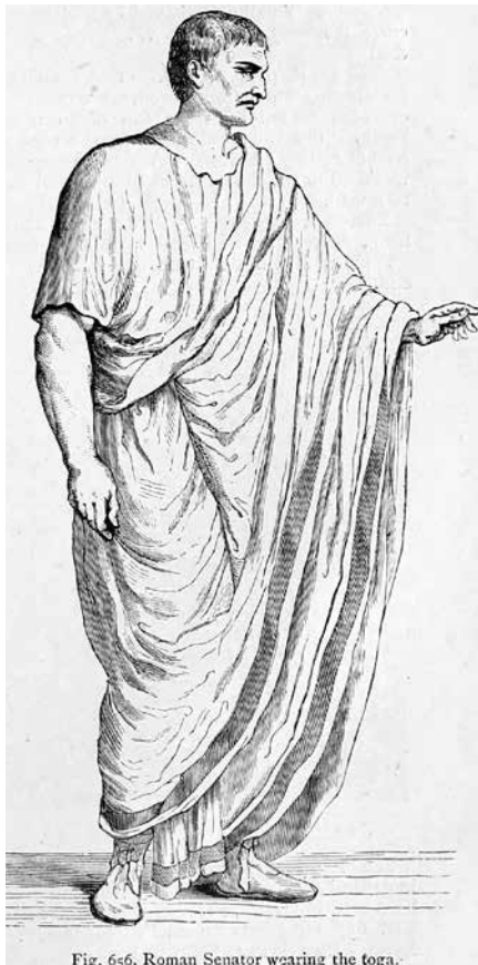
Fig. 6c6. Roman Senator wearing the toga.