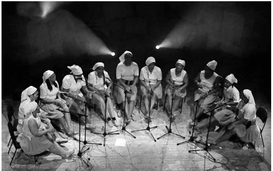
Actuación de Batuko Tabanka

Un dez. Un 100%. Toda a xente, agás ese veciño, o resto un 10. Se me pasa calquera cousa, todo o mundo pregunta: que che pasa? Queres que te levemos a algún sitio? Dígoche e digo sempre que desexaría ter un brazo moito máis longo para xuntar a xente, incluso practicamente España enteira, que por onde fun todo o mundo me quixo ben, para abrazalo. Sempre me levei ben con todos. Teño uns veciños asturianos cos que comparto parede medianeira e fixe-