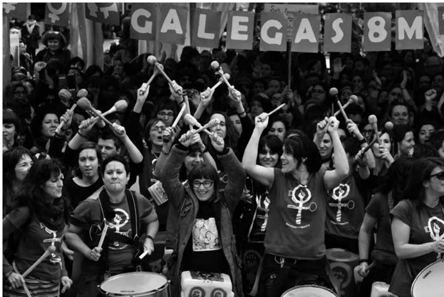
As Tamborilás da batukada feminista na manifestación de Vigo

As mobilizacións feministas do pasado marzo sorprenderon a toda a sociedade e marcaron un antes e un despois na historia da loita pola igualdade. En termos relativos, Galicia foi un dos territorios onde a mobilización foi máis intensa.