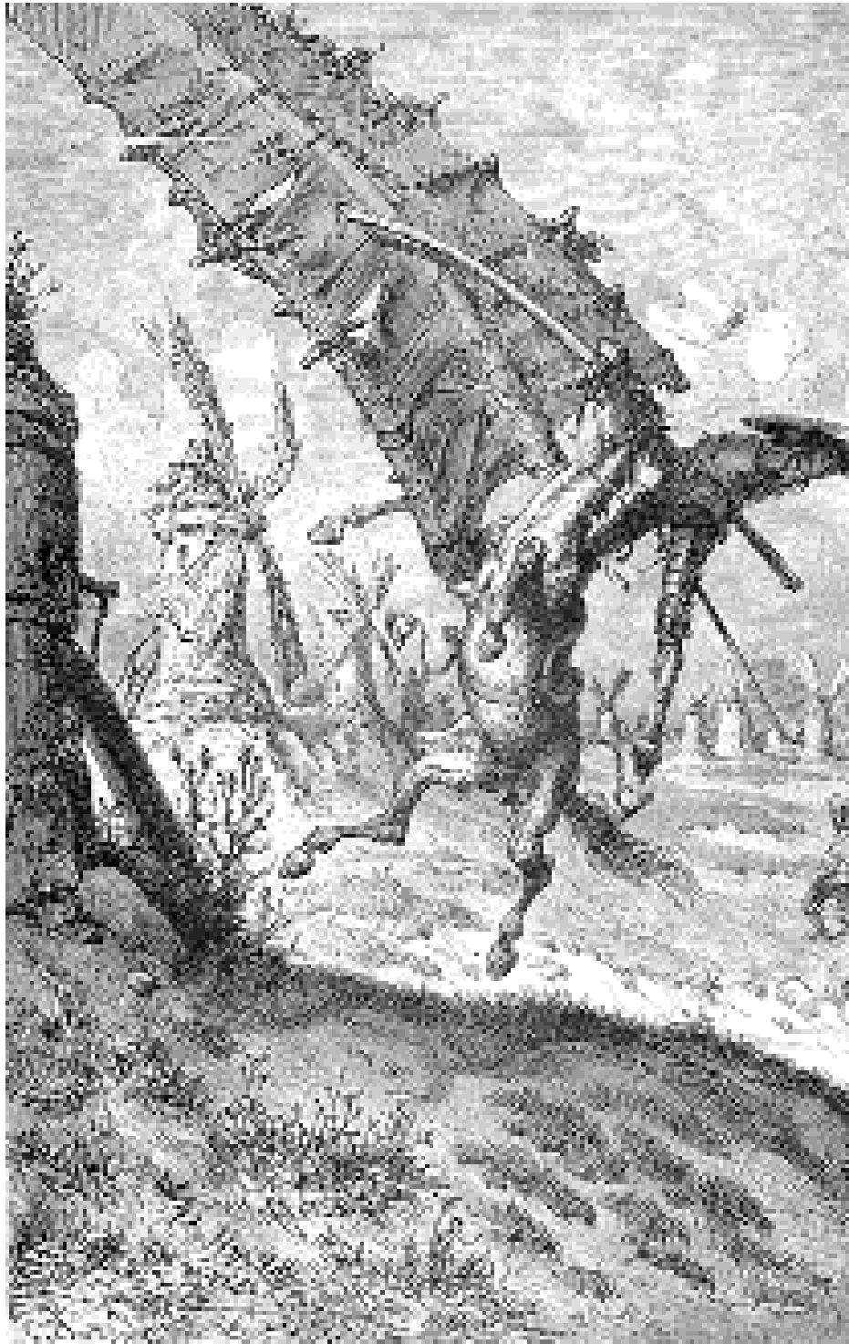
Un dos famosos gravados de Gustavo Doré para o Quixote.

"No Quixote ficamos nido que Cervantes tenta representar España como un espazo común, fertilizado por un ricaz mosaico de identidades diversas, xunguidas por vencellos históricos, relixiosos e políticos, cuxa embigueira era a figura do monarca"