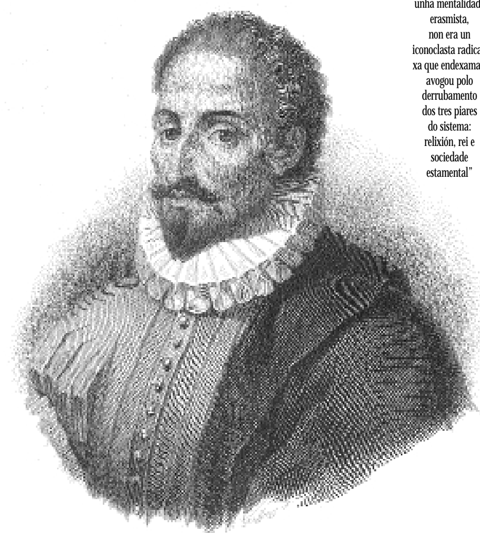
Gravado de Cervantes debido a Geoffroy.