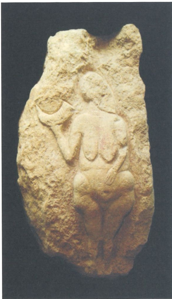
Relevo da Venus de Laussel (de hai 25.000 anos), descuberto en 1909 en Marquay, Dordogne, Francia

Iris M. Young vai soste que, malia que a análise de Okin respondía ao contexto dos Estados Unidos dos anos setenta e oitenta, a lóxica estrutural básica do ciclo da vulnerabilidade segue revelando importantes aspectos da opresión de xénero na maioría das sociedades do mundo hoxe (2009: 228), describe ben as relacións que condicionan e constrinxen as vidas de moitas mulleres, de xeito que gran parte da estrutura básica de sexo-xénero como a teorizou Okin “permanece intacta”, por máis que a lóxica estru-