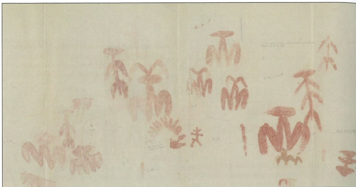
Reproducción dunha pintura rupestre realizada por Francisco Benítez Mellado en Peña Escrita, Fuenaliente (Cidade Real), onde aparece unha das primeiras representacións dun parto, de hai 6.000 anos.