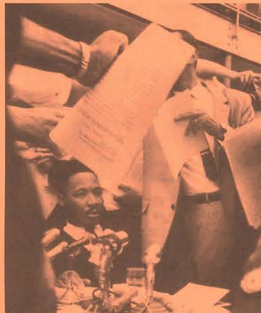
Martin Luther King, durante a súa campaña contra a segregación nos comedores escolares en Birmingham, en 1963.

Rawls fai fincapé en que a desobediencia civil é un acto político, público e non violento. En primeiro lugar, é un acto político, non só porque vai dirixido á maioría que detenta o poder, senón, fundamentalmente, porque é un acto guiado e xustificado por principios políticos, a saber, os que regulan as institucións. Polo tanto, a desobediencia civil apunta á xustiza básica da sociedade, á concepción da xustiza comúnmente compartida, presuposta nun réxime democrático moderno. Dito doutro xeito, a minoría apela ó sentido de xustiza da maioría para que este recoñeza as lexitimas pretensións da minoría. En segundo lugar, a desobediencia civil é un acto público: ten lugar no ámbito público, manifestase abertamente. En terceiro lugar, a desobediencia civil non é violenta. A violencia é incompatible con ela, entende Rawls, xa que do que se trata é de reflexionar sobre conviccións comúnmente compartidas. Pero, ademais, insiste, non é violenta porque a desobediencia á lei dase dentro dos límites, aunque nos límites externos, da fidelidade a lei. Por iso, considera que a desobediencia civil está xustificada unicamente cando se dan graves infraccións dos principios de xustiza, do principio de igual liberdade, ou violacións do principio de igualdade equitativa de oportunidades. Agora ben, o segundo tipo de violacións son máis difíciles de recoñecer e existe unha maior diferenza de opinións ó respecto, polo que Rawls mantén que a desobediencia civil refírese fundamentalmente ó