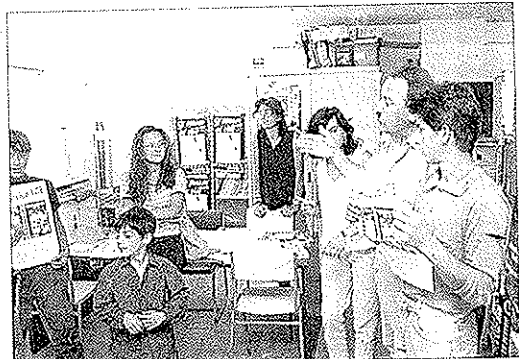
Foto de archivo de socios del centro sociocultural de Vite

Para hacer frente a los rigores del invierno, el centro sociocultural de Vite ha organizado un intensivo programa de actividades, en el que se incluye la actuación teatral de Berenguela , esta tarde, a partir de las ocho. Asimismo, se están realizando cursillos de judo, inglés, esmaltes, relajación y fotografía. Por otra parte, el centro sociocultural de Marantes acoge un cursillo de jardinería.