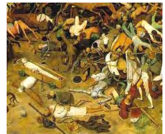
Bruegel: El triunfo de la muerte (detalle), 1562