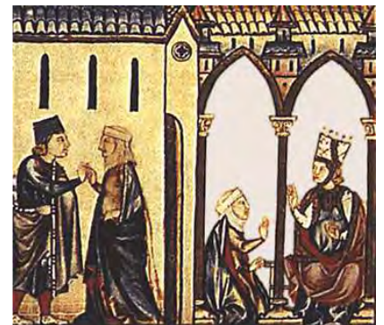
Un enamorado contrata a una alcahueta para conquistar el corazón de su dama Miniatura de las Cantigas de Santa María , de Alfonso X el Sabio

Siguiendo su costumbre, estas tales bufonas 700 andan de casa en casa vendiendo muchas donas; nadie sospecha de ellas, están con las personas, mueven, con sus soplidos, molinos y tahonas.