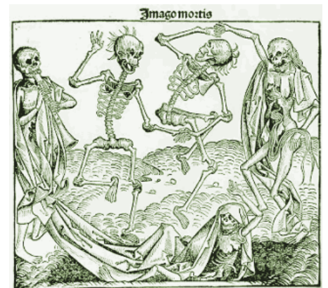
Liber Chronicarum (1493)