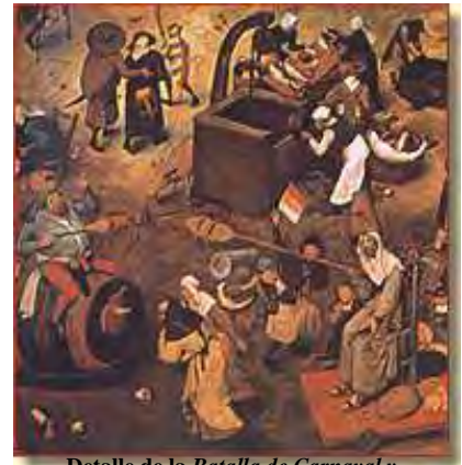
Detalle de la Batalla de Carnaval y Cuaresma , de Brueghel el Viejo (1559)

Vencen las tropas de doña Cuaresma, y don Carnal es hecho prisionero. Un fraile le obliga a hacer penitencia, lo cual permite al Arcipreste explicar las virtudes de la confesión. Don Carnal, sin embargo, consigue escaparse tras su falsa confesión e imponerse así sobre doña Cuaresma, que se va de peregrinación a Jerusalén. El día de Pascua de Resurrección entra triunfante en el mundo acompañado de don Amor: