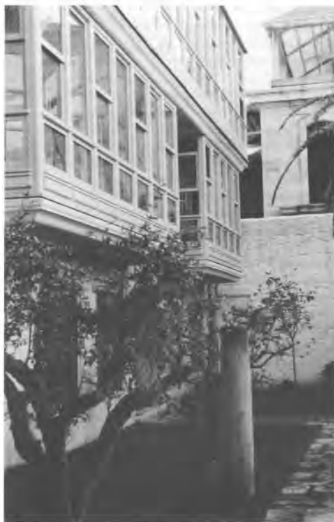
Cooperativa de vivendas de San Martiño (Pontevedra)

R: Si, a cidade é un modelo que se trasladou a outro lugar pero perdendo o significado orixinal do que se copia. Pensa no absurdo que son os voadizos no campo: estás aplicando un recurso que ten un fin meramente especulativo e consiste en aproveitarse do espazo colectivo para gañar uns metros máis á construción. Isto no campo non ten sentido ningún. Ben, é un exemplo e eu tampouco estou de acordo en que se faga na cidade por moita explicación que teña. Funciona o modelo e funciona tamén que hai moito constructor que convence ó paisano de que opte por unha nova edificación porque unha rehabilitación é máis problemática e lle vai supoñer maior esforzo. Pero por outra parte este transvase de elementos de outro medio ou lugar non ten por que dar resultados negativos, pensa nas casas dos indianos, son casas espléndidas, é xente de cartos que trae unha información de fóra non estereotipada. Sempre se funcionou de forma parecida o que pasa é que antes facíase de xeito máis limitado porque cada casa