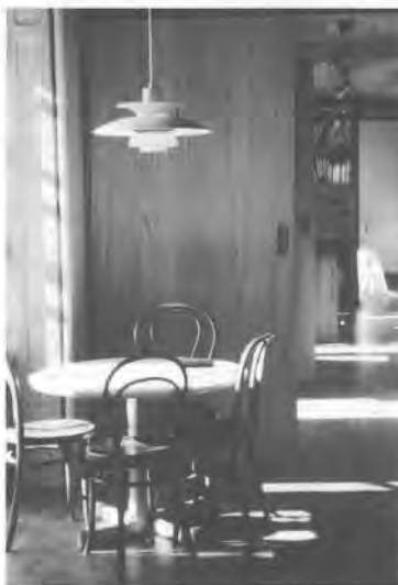
Cooperativa de vivendas de San Martiño. (Pontevadra)