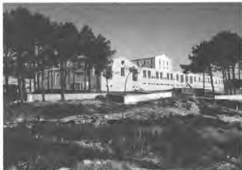
Centro de PP. de Actuacións da Illa de Arousa.

R: Ben, pero se te fixas, os edificios dos cascos históricos manteñen unhas constantes en canto a materiais, tipoloxía da carpinte-