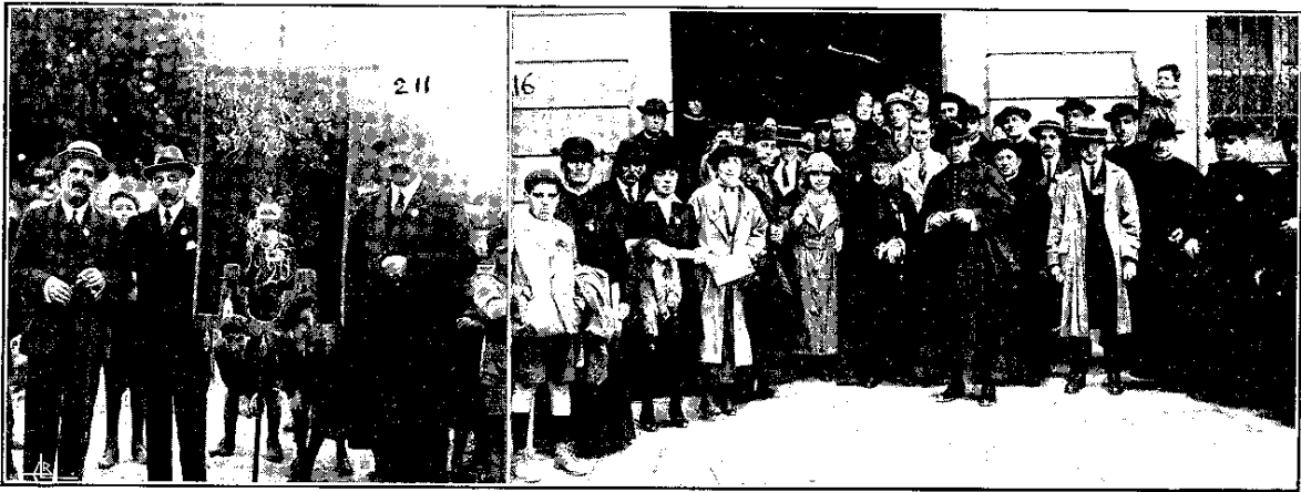
Estandarte de la sección de hombres.—La presidencia de la peregrinación.