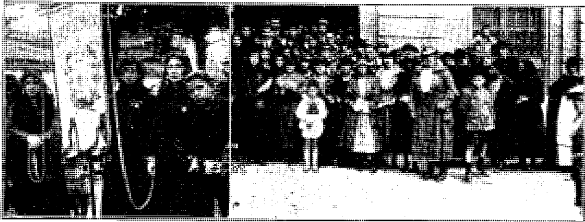
El estandarte de la sección de señoras.—Un grupo de peregrinas distinguidas