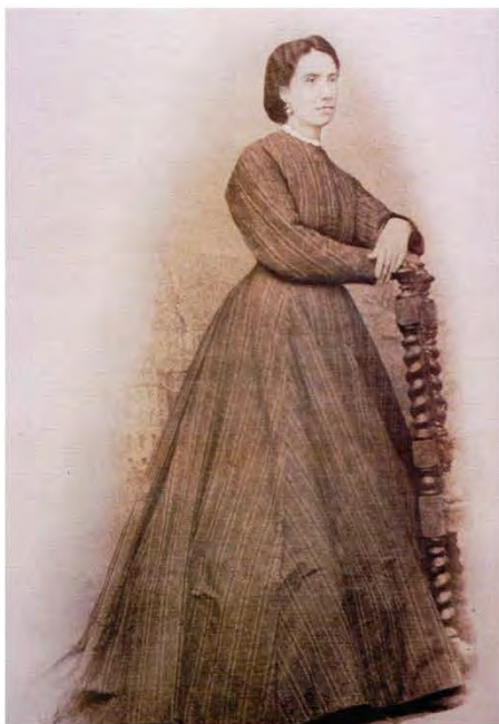
Rosalía Castro de Murguía (1860 ca.)