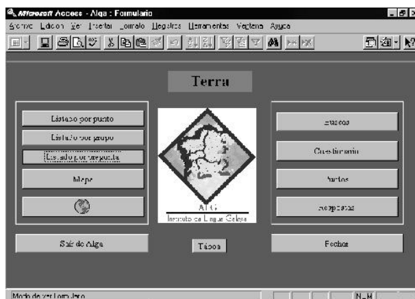
Figura 5, Menú principal

zanse para crear informes impresos dos cuestionarios. Estes informes empréganse como borradores para corrección e como primeiras guías para a confección dos mapas (selección de formas que se van representar, cómputo das variantes de cada mapa, etc.). Se picamos Listado por punto conseguimos unha relación de tódalas respostas do punto escollido; ó seleccionarmos Listado por grupo obtemos un repertorio de tódalas respostas diferentes e ó seu carón o número de veces que aparecen; con Listado por pregunta temos como resultado un catálogo de tódalas repostas á mesma pregunta nos distintos puntos enquisados.