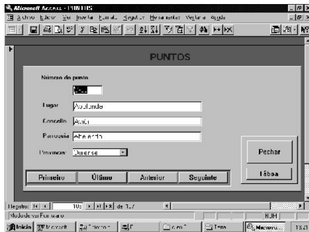
Figura 1, Formulario Puntos

formulario vinculado a esta táboa non se mostran os dous campos que sinalan as coordenadas (Figura 1).