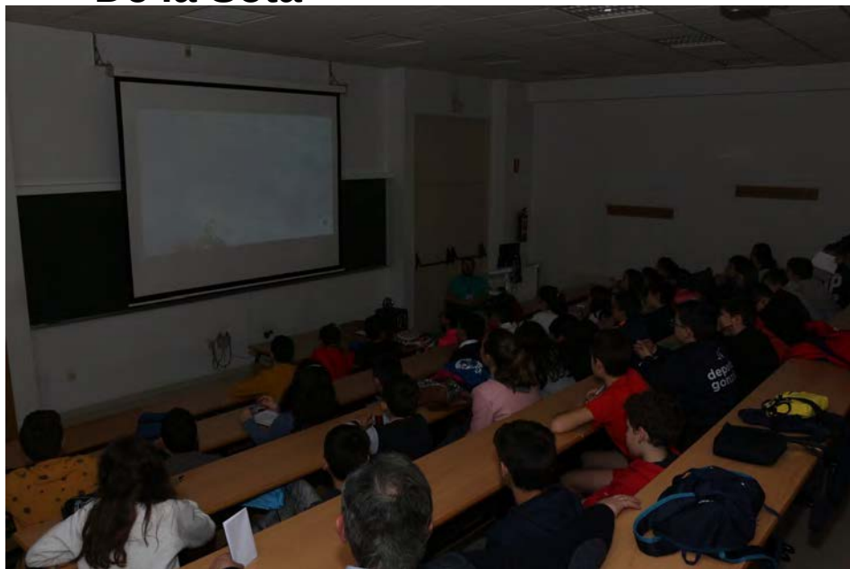
Ciencia visión. Divulgare, Cátedra de Cultura Científica da Universidade do País Vasco, Universitat de Barcelons e Alberto Redondo Doc.