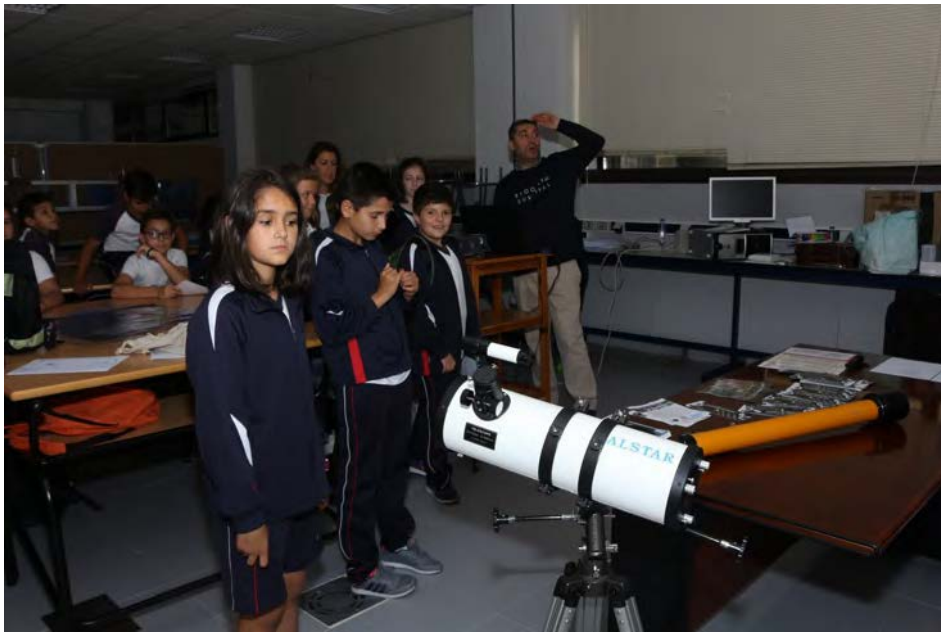
Como funciona un telescopio (FC3. Fundación Ceo, Ciencia e Cultura)