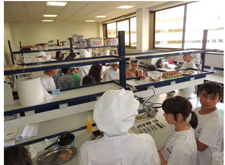
Ciencia na cociña. CIFP Carlos Oroza