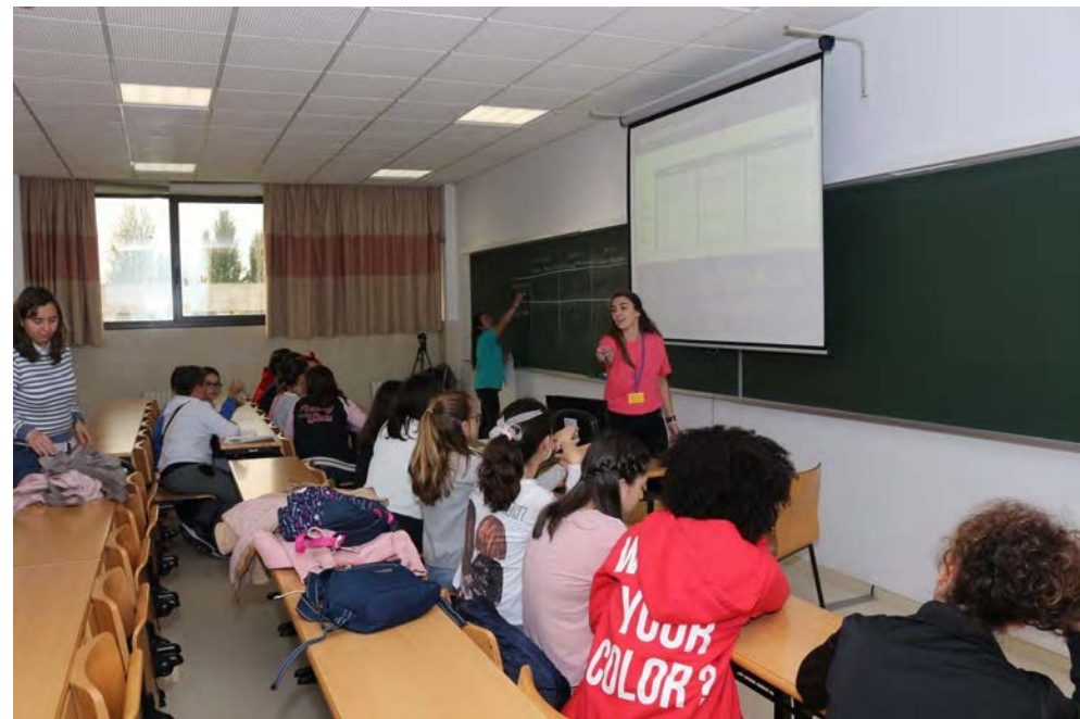
Detectives das fotografías. Ana Cao