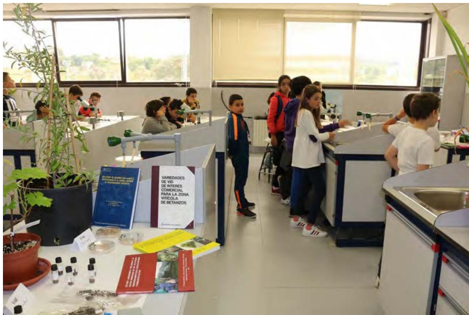
As plantas tamén sofren. CSIC