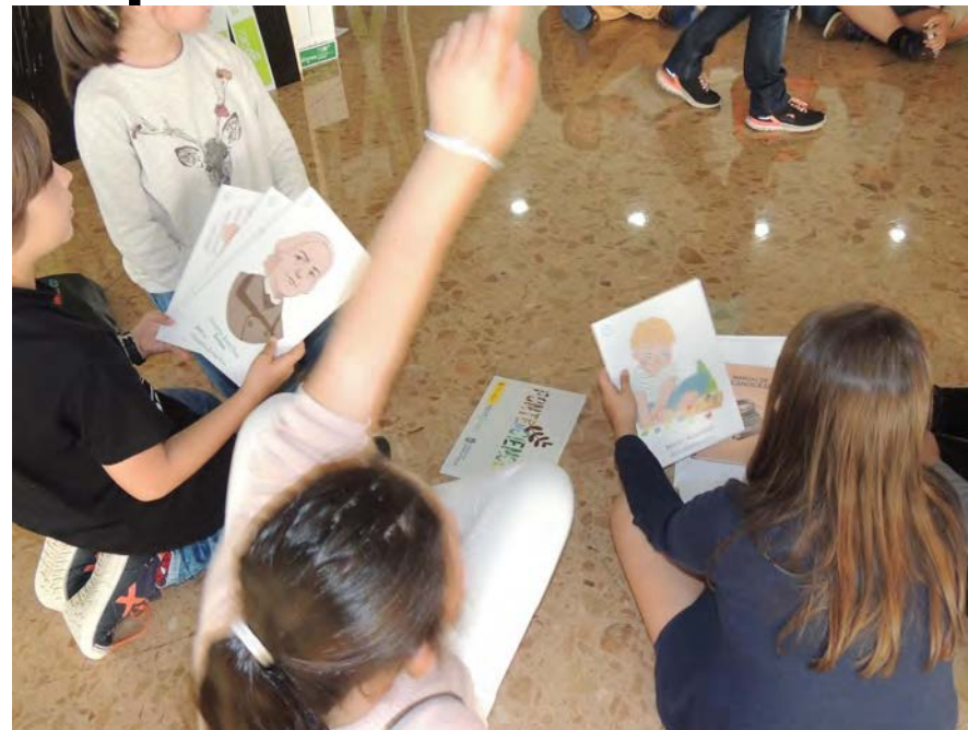
Exposición “ Mulleres faro ”