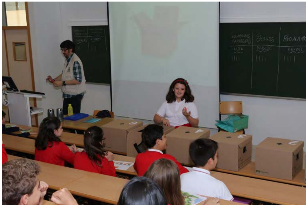
Arqueoloxía dos sentidos