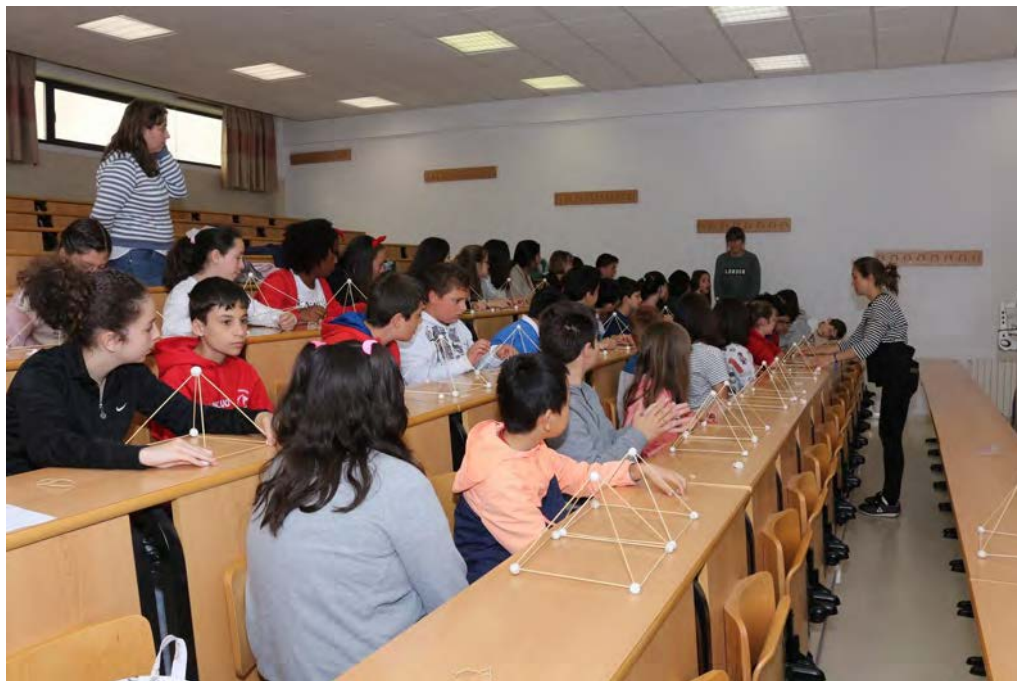
De la Sota