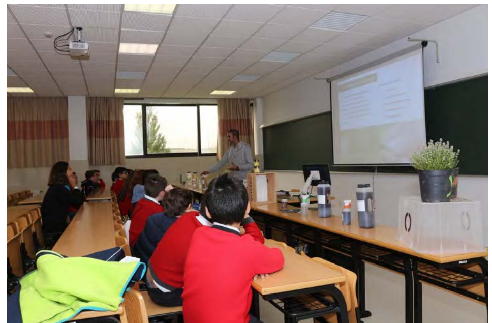
Como protexer as túas plantas. Orballo