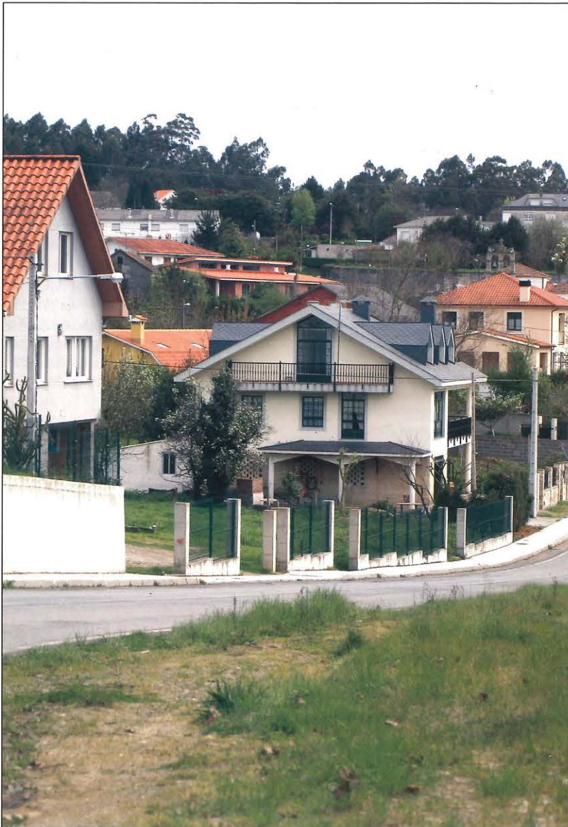
Baldomir, aldea da parroquia de Guísamo (Santa María), no concello coruñés de Bergondo.