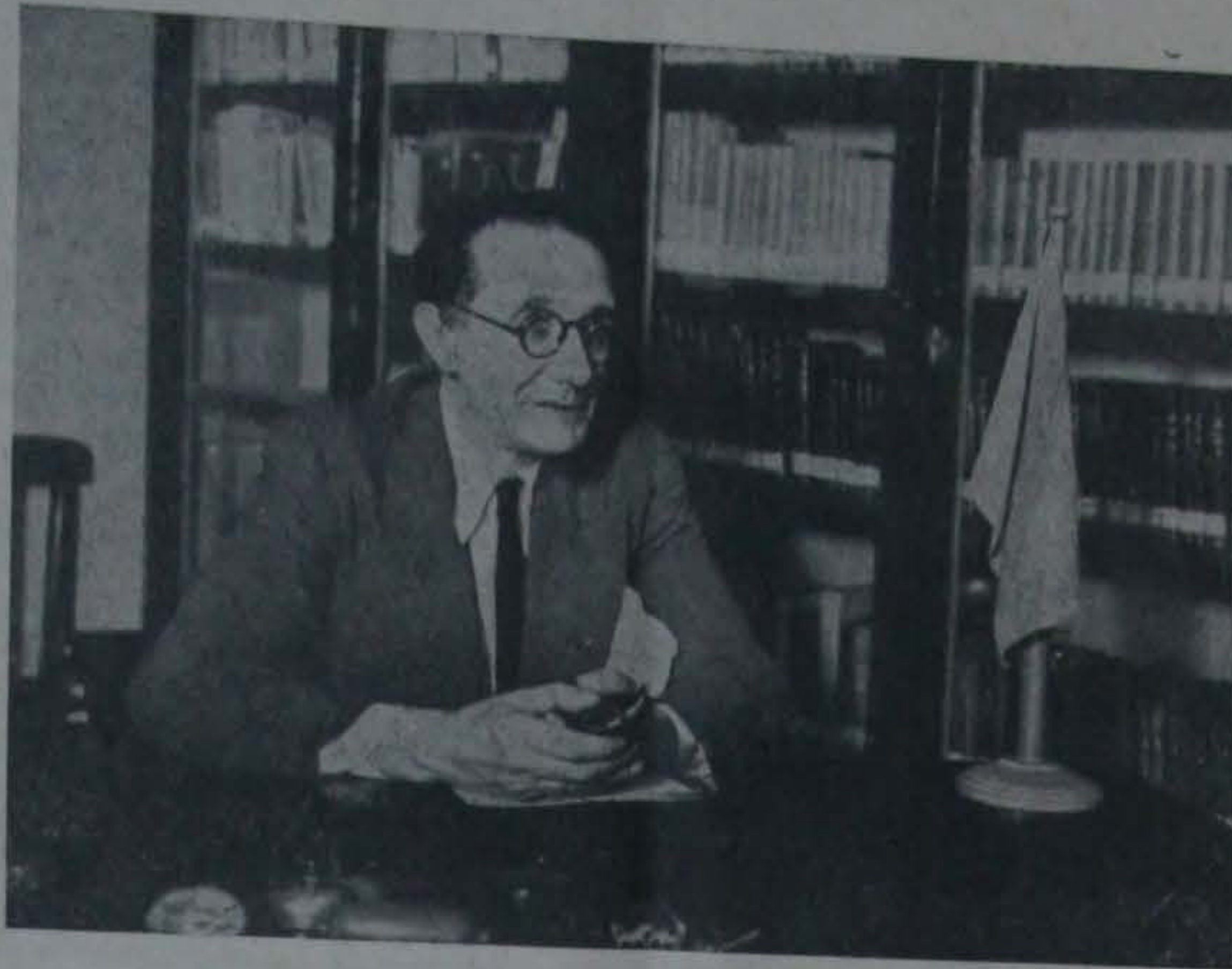
Castelao na biblioteca do Centro Orensano de Bós Aires (Iste é súa derradeira fotografía)

Era o Día de Galiza, ó 25 de Xullo de 1949. Castelao levaba meses aturando a súa cruel enfermidade. Até o seu leito chegaranlle, en tan sinalada data, moitísimas mostras de agarimo: