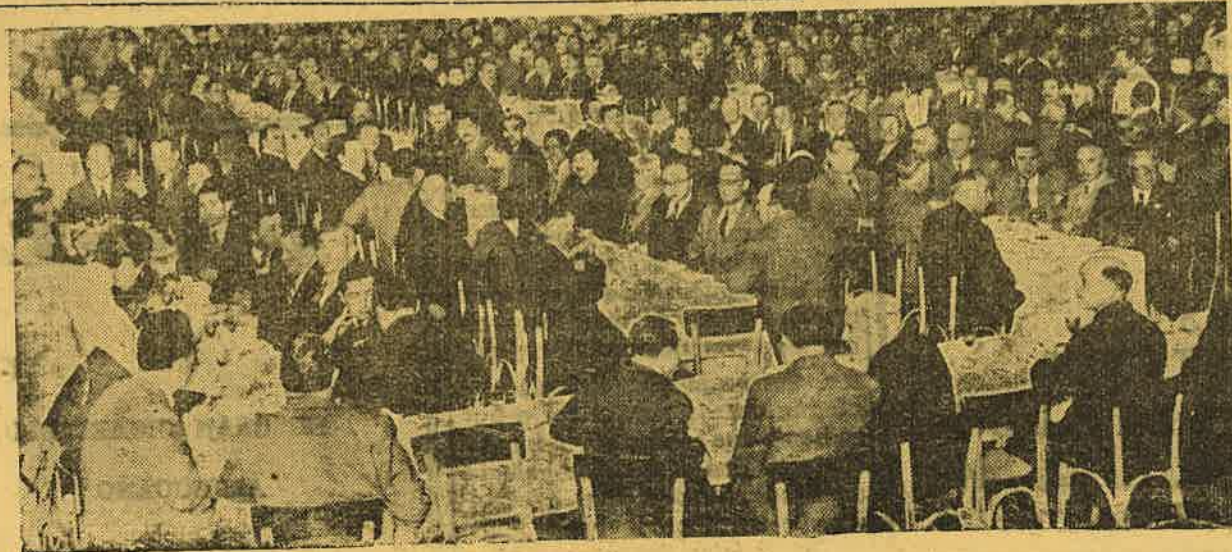
O público de pé, escoitando o Hino