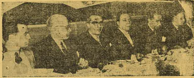
A cabeceira do banquete

O público, posto en pé, tributou unha ovación interminabel ao meirande persoeiro da nosa Terra. Así finou o emocionante aito que lembrou o día do Plebiscito Galego.