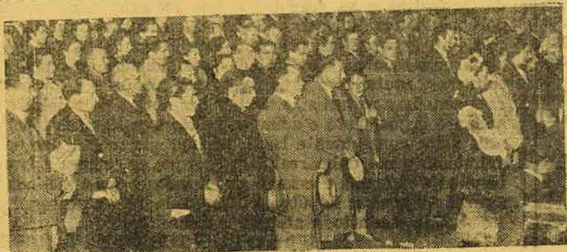
Vista parcial do banquete