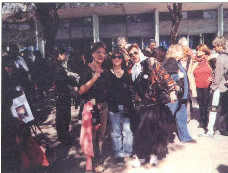
Marcha en lembranza dos desaparecidos de Ledesma, na coñecida como “Noche de los apagones”.

Ninguén. Ninguén quería saber nada. O Partido Revolucionario dos Traballadores axudaba, pero pouco podía facer, fóra dos habeas corpus e cousas así. Outros, co tempo, quixeron meterse, xurdiron algunhas asociacións, pero cada quen quería levar a auga ao seu rego. No fondo, manipulábanos, ou querían manipularnos, ou sentíamonos manipuladas, non sei, por uns e por outros, cando o que nós reclamabamos era simplemente a recuperación dos nosos fillos, ¡noticia dos nosos fillos, que os roubaran diante de nós, e que eran cidadáns da República, unha República que supoñíamos civilizada, unha República que considerabamos o noso país, a nosa patria, e que se manifestaba como a cousa máis negra que podíamos imaxinar! Claro que visto así, e